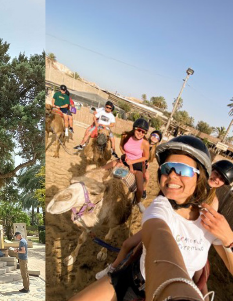
Kamelselfie på ridetur i Judea-ørkenen