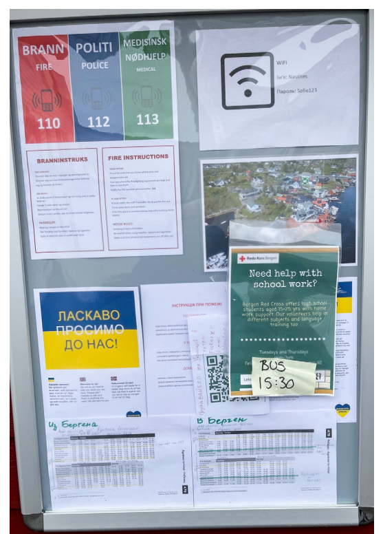
Informasjon på engelsk, ukrainsk og norsk