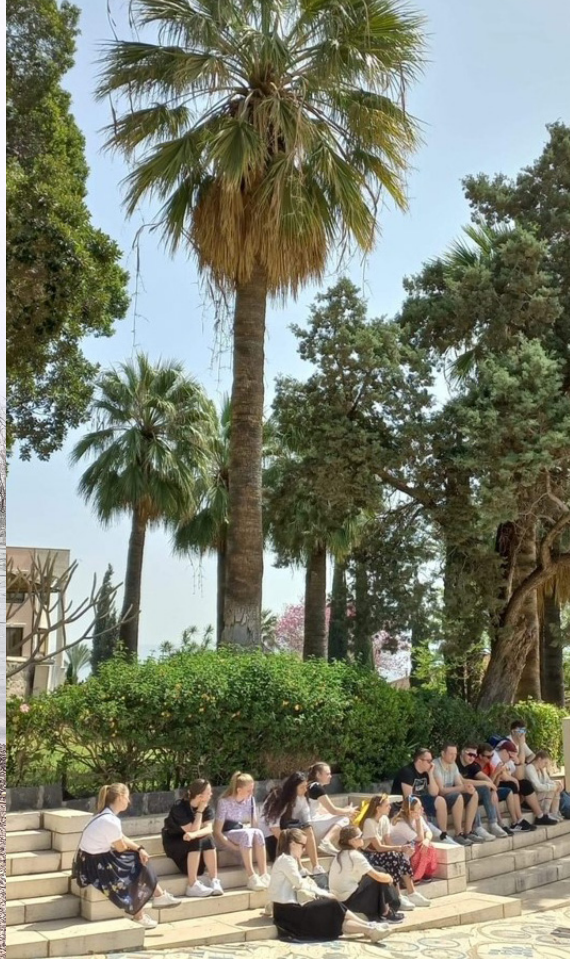
På Saligprisningenes berg, der Jesus heldt Bergpreika