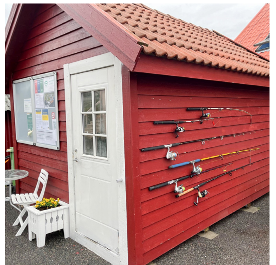
Fiskestenger til utlån