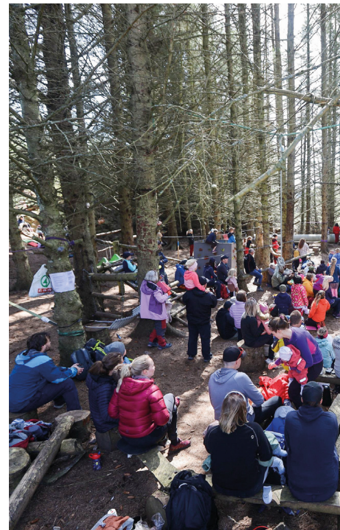
Publikum på teateroppsetting i Planteskogen