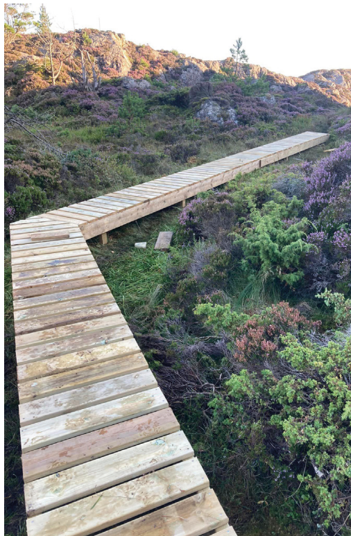
Mange klopper er bygd, så ein kan gå tørrskodd på stiane