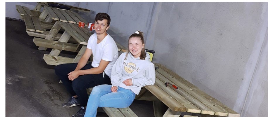
Fire benkar snart klare