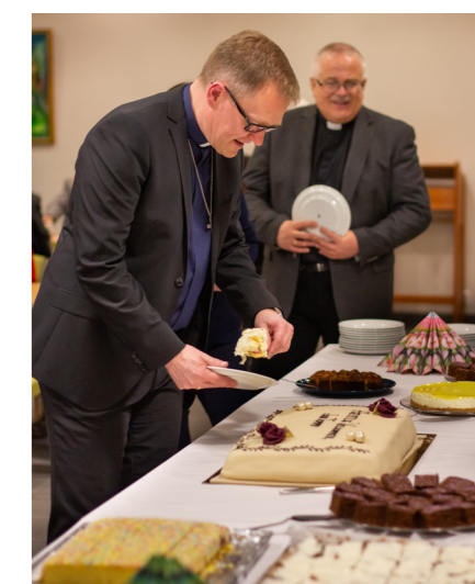
Den nye prostens forsyner seg av kake.