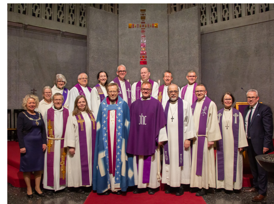
Biskopen, prostiets prestar og diakonar saman med ordførarane frå Askøy og Øygarden.