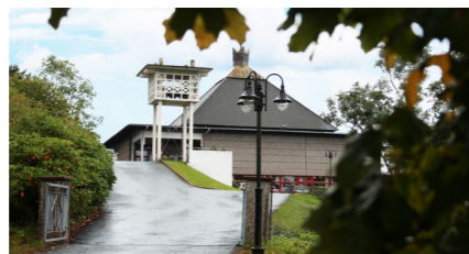
Landro kyrkje - byggjeår 1977