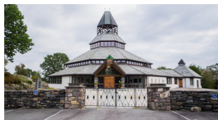
Sund kyrkje - byggjeår 1997