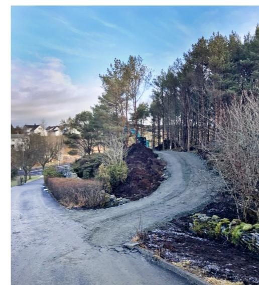
Vegen opp til nytt tårn