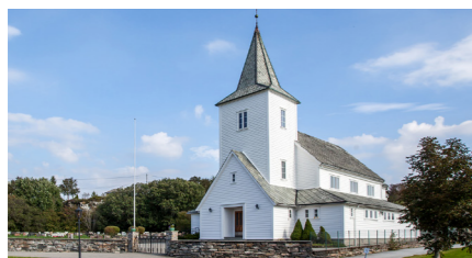
Kausland kyrkje - byggjeår 1881