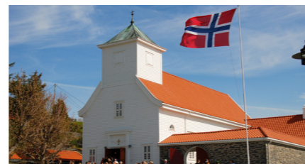
Blomvåg kyrkje - byggjeår 1931