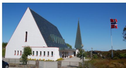
Hjelme kyrkje - byggjeår 1971