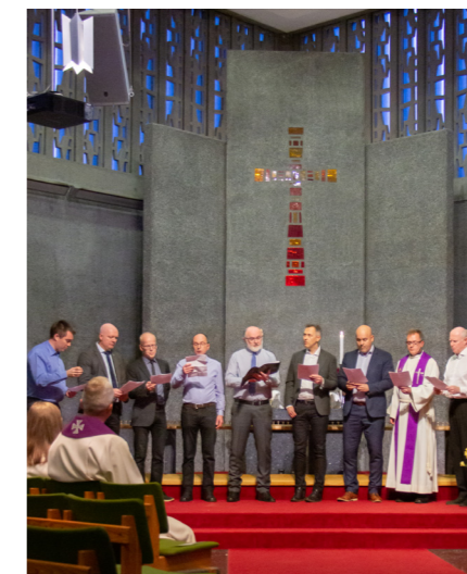
Mannskoret AvogTil bidrog med song.