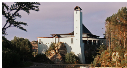
Foldnes kyrkje - byggjeår 2001