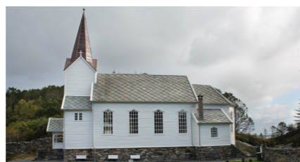
Hjelme gamle kyrkje - byggjeår 1875

Kyrkjelova seier dette om forvaltninga av kyrkjene: