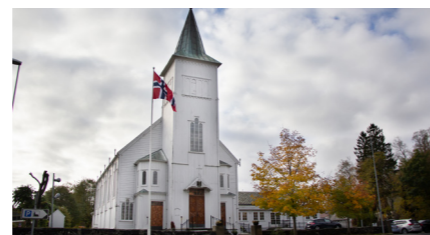
Fjell kyrkje - byggjeår 1874