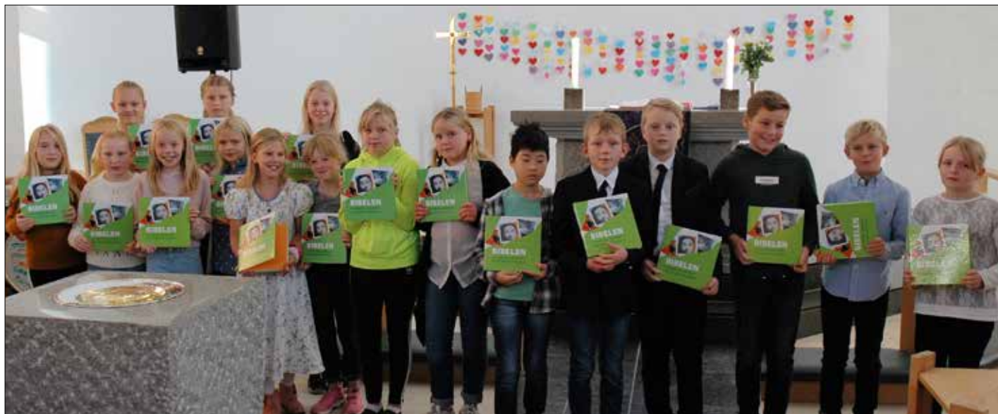
Elevar frå 5.klassar i Sund viser fram bibelbøkene som dei har fått.