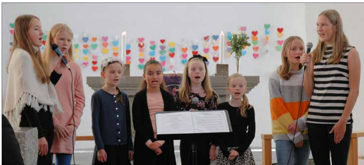
Betweenkoret song i denne gudstenesta.