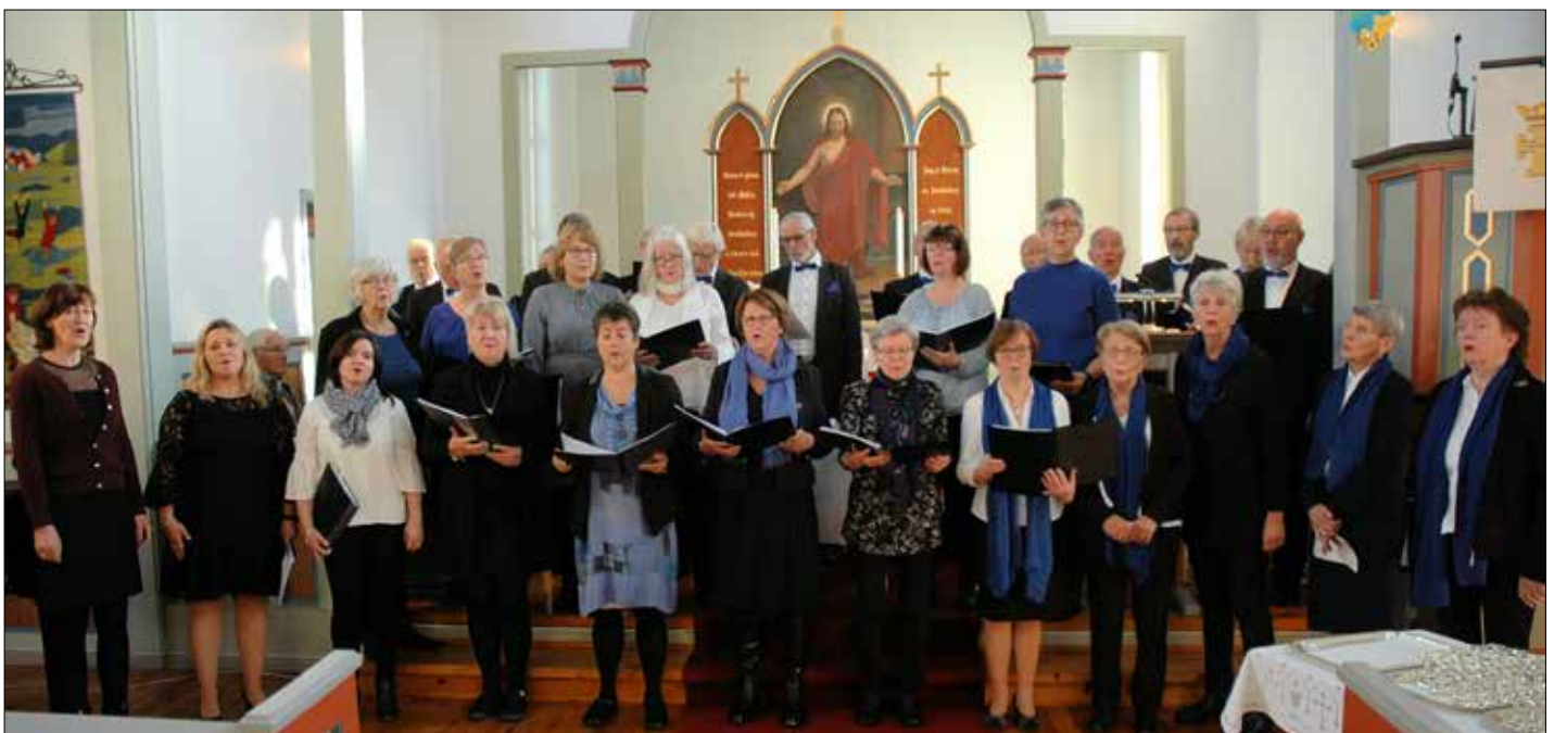
Sund Blandakor song i gudstenesta på Allehelgenssøndagen.