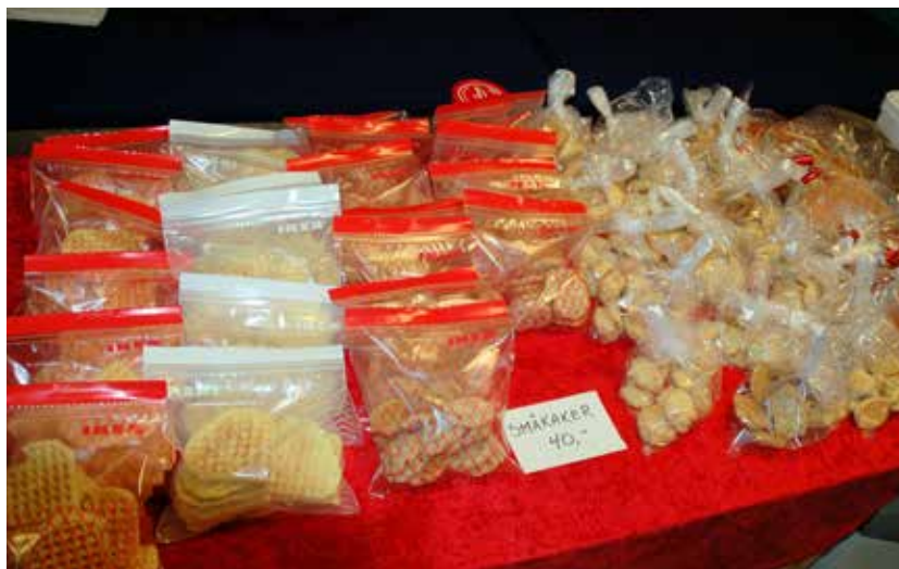
Diverse småkaker var noko av det ein kunne kjøpa.