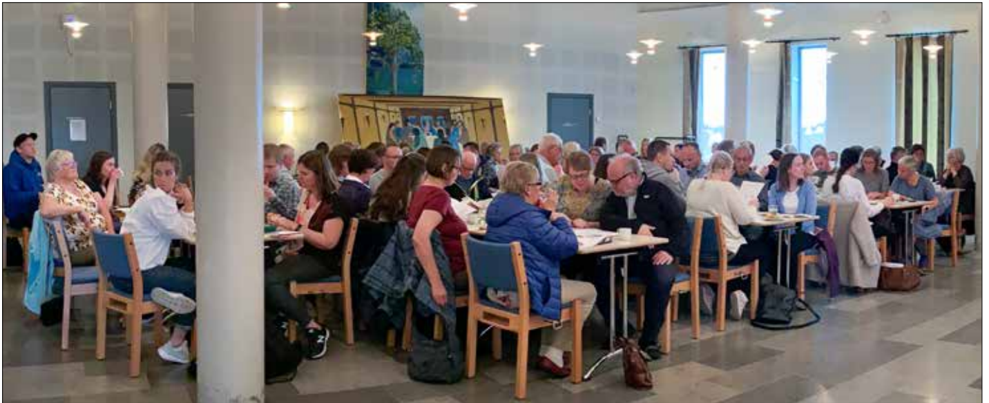
Sokneråda og kyrkjestaben i nye Øygarden kommune samla i kyrkjelydssalen i Foldnes kyrkje.