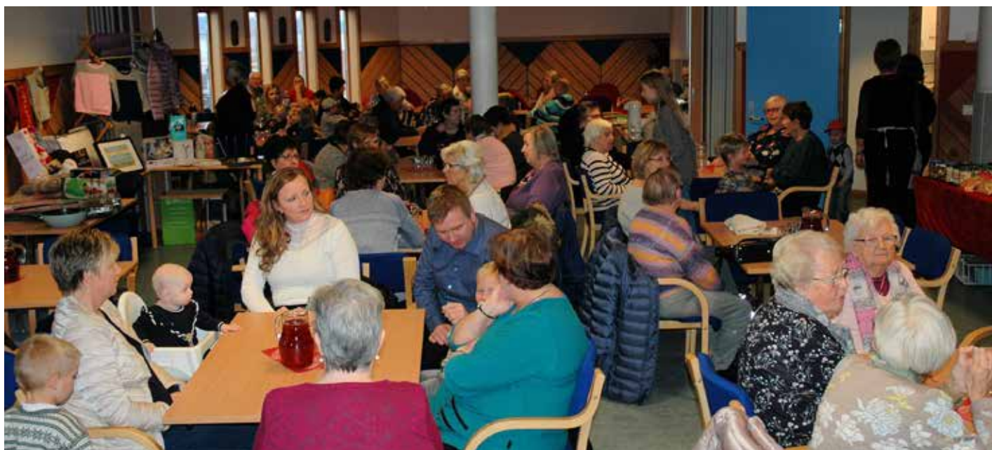
Det blei fullt rundt alle borda i Kyrkjekjellaren.