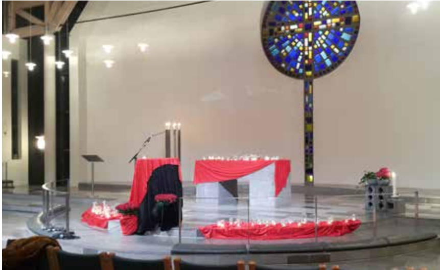
Foldnes kyrkje var fint pynta.