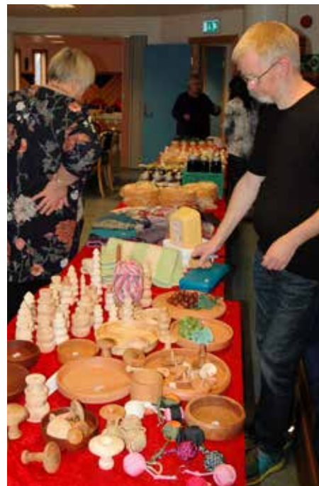
På eit langbord var det ei rekkje ting som ein kunne få kjøpa.