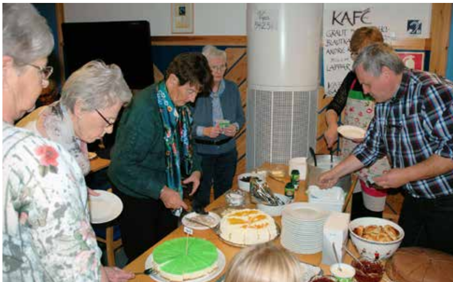
I kaféen kunne ein få både god graut og gode kaker.