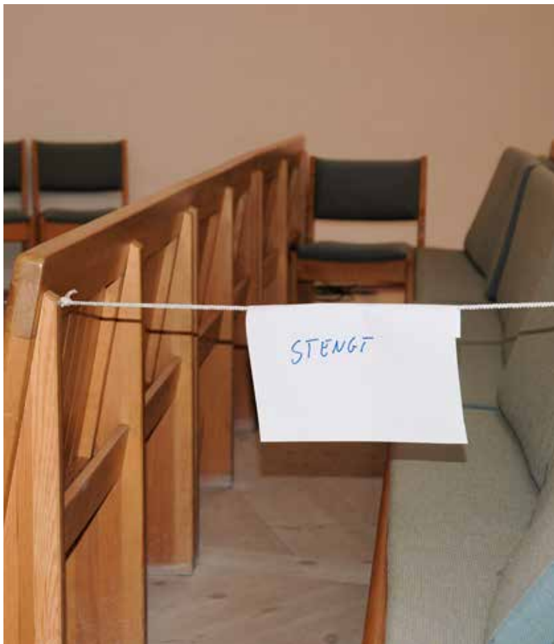
Annakvar benkerad var stengt for kyrkjelyden. Ein skulle sørga for god avstand mellom personane, i allfall dei som ikkje budde i same husstand.