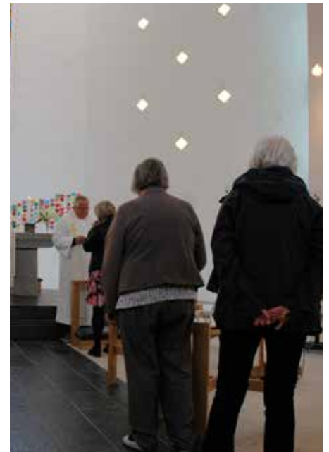
Nattverd gjestane måtte stilla seg på rekke nedover midtgangen med minst 1 meter i mellom kvar person.