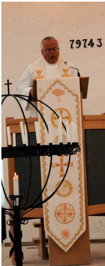
Presten nytta seg av preikestolen då han hadde preika på denne første søndag etter gjenopning av kyrkjene.

Etter å ha vore stenge i over to månader kunne kyrkjene igjen opnast for inntil 50 personar. I Sund kyrkje skjedde dette søndag 24. mai, helga før pinse.