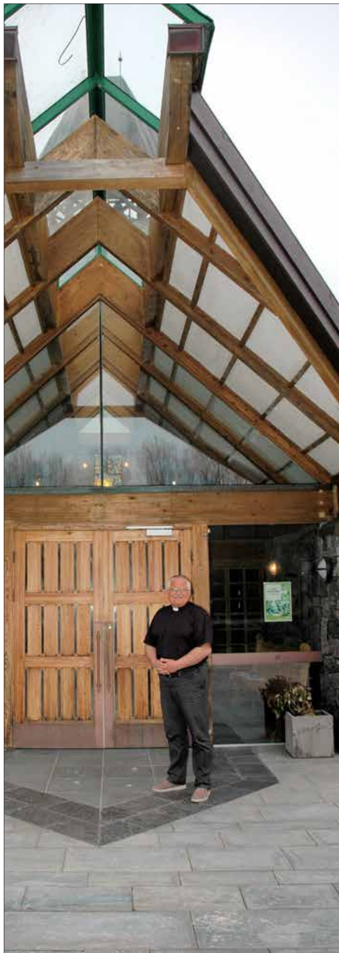
Under koronarestriksjonane er det helst utanfor kyrkja at presten har kunna ta imot folk.