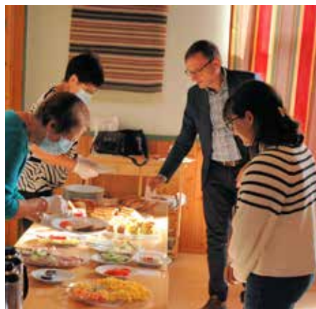
Det galdt å følgja visse korona-reglar ved servering av lunsjen, som alltid er ein del av føremiddagstreffa.