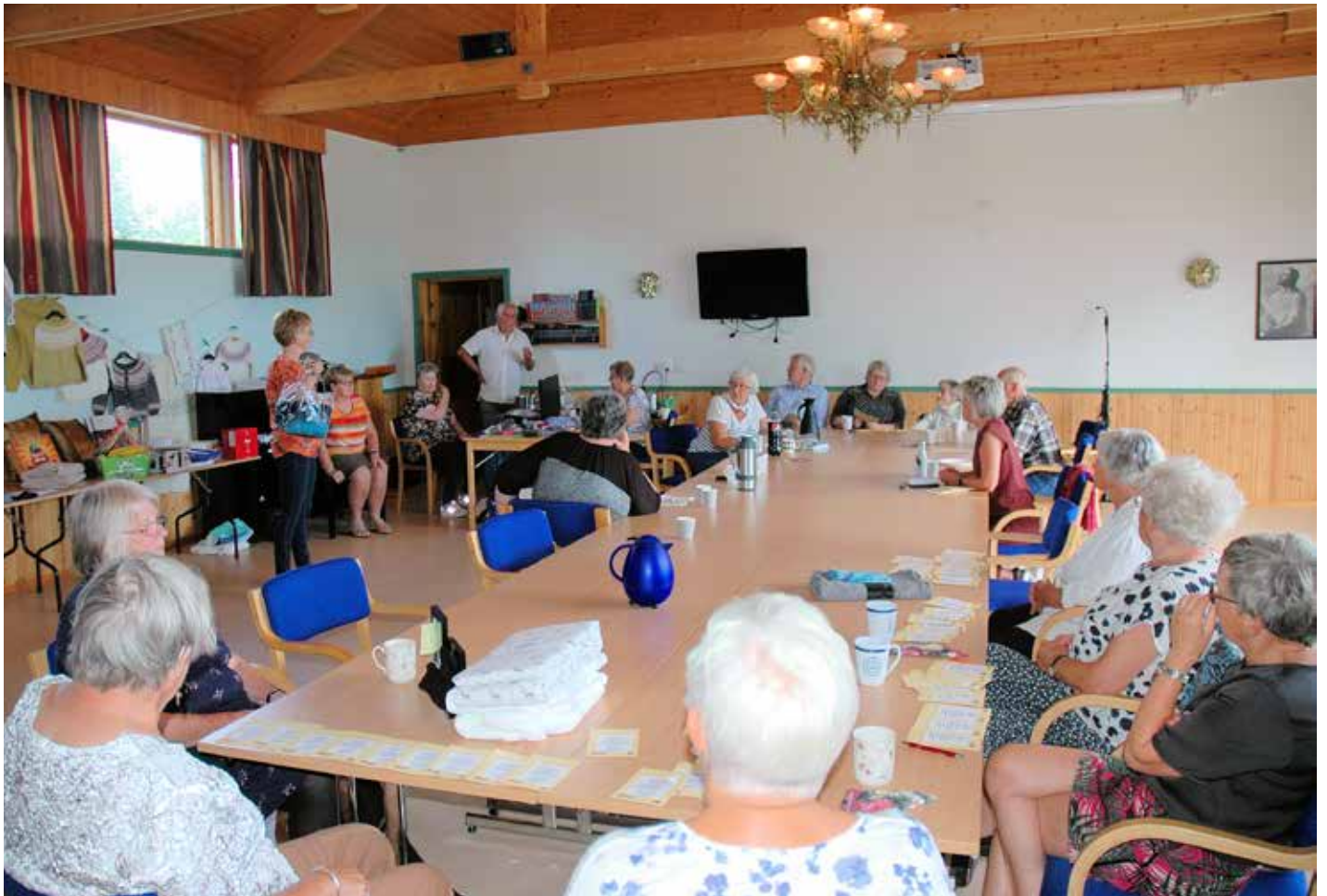
Komiteen for Vårmarknaden samla i august for å føreta trekninga av gevinstane som var komne inn og som hang på veggen eller låg på borda under vindaugo.