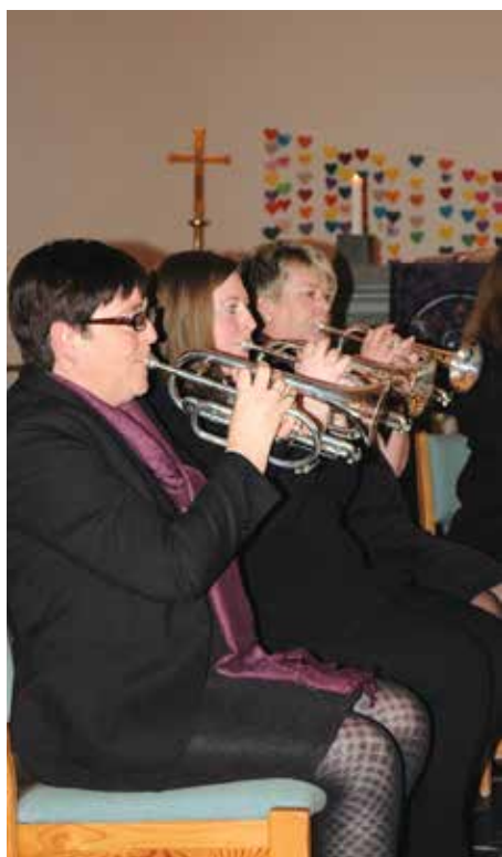
Her er tre av medlemene i Sund Brass.