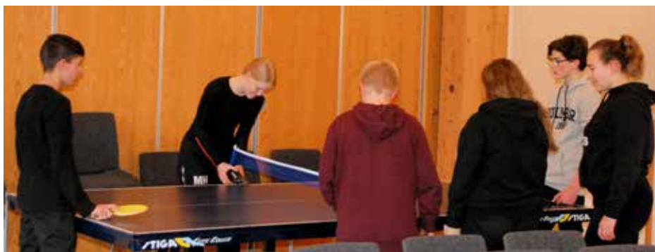
Her gjer ein klart til litt bordtennis.