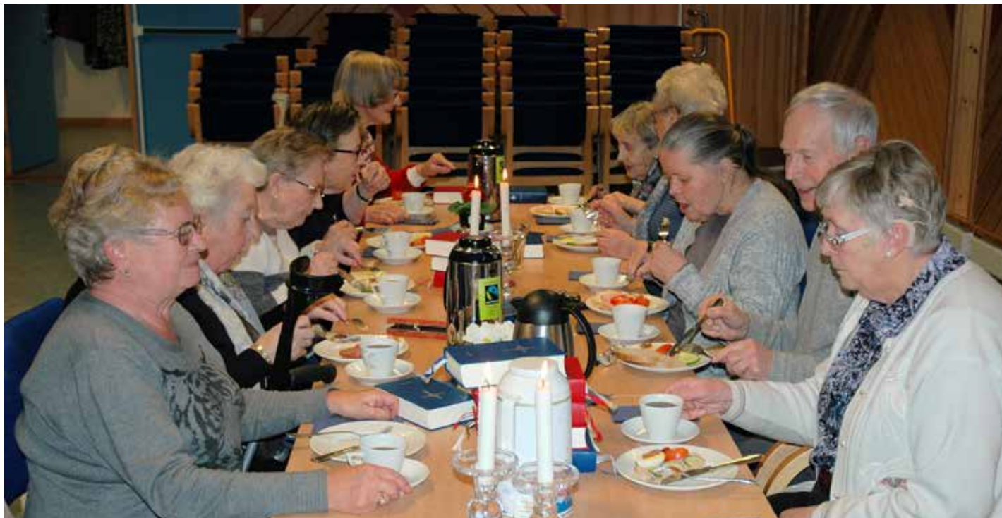
Bordfelleskapet er ein viktig del av føremiddagstreffa.