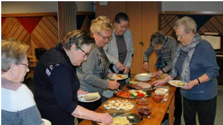
På føremiddagstreffa er matbordet dekkja, så her er det berra å forsyna seg med lunsj.