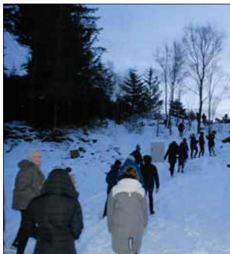
Godt å få seg ein fin tur ut i nydeleg vinter-vær før kvelden.