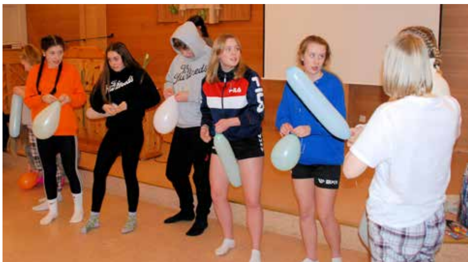
Leikar av ulikt slag var det mange av på konfirmantleiren.

det vonde som kom inn i verda allereie med dei aller første menneska og som har halde fram med å vera mennesket si største utfordring – synda vår; at ingen av oss får til (og heller ikkje alltid ynskjer) å leva etter Guds gode, kjærlege vilje. Seinare på dagen vart dette følgt opp med undervisning om frelsa – korleis Gud sjølv, gjennom Jesus, har ordna opp for oss av berre nåde!