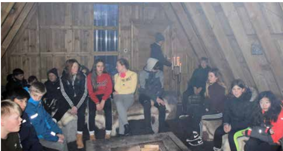
Målet for friluftsturen var ein stor, flott lavvo inne på Skogtun camping. Der blei alle tatt imot av presten og Søgne, som underviste om Jesus.