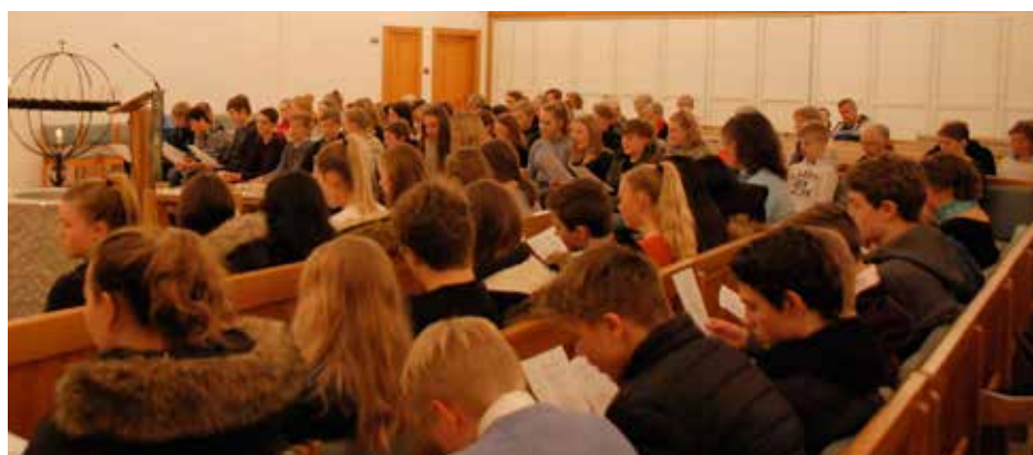
Konfirmantane utgjorde ein god del av forsamlinga i Sund kyrkje denne kvelden.

Dag Reidmar Pettersen