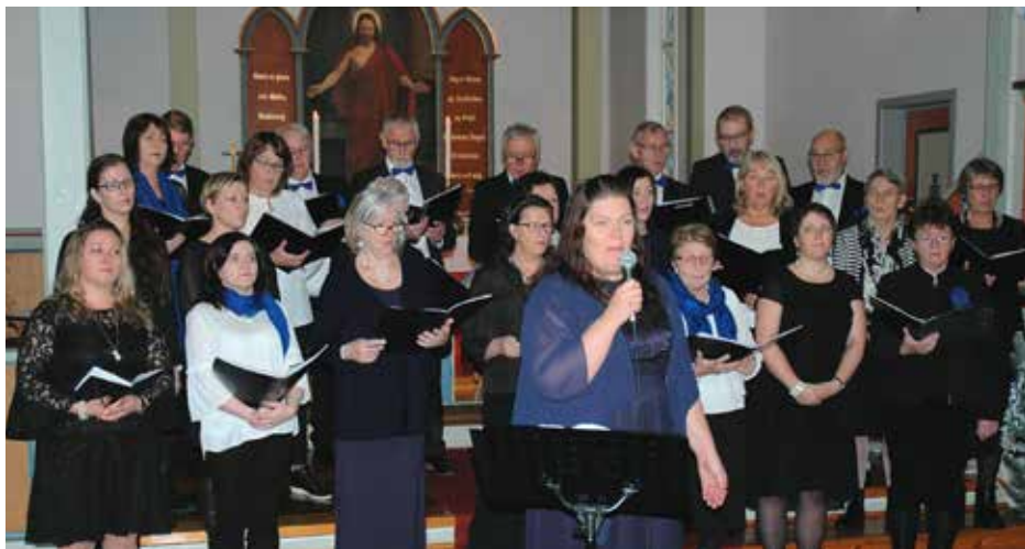
Sund Blandakor song på gudstenesta i Kausland kyrkje 2. juledag.