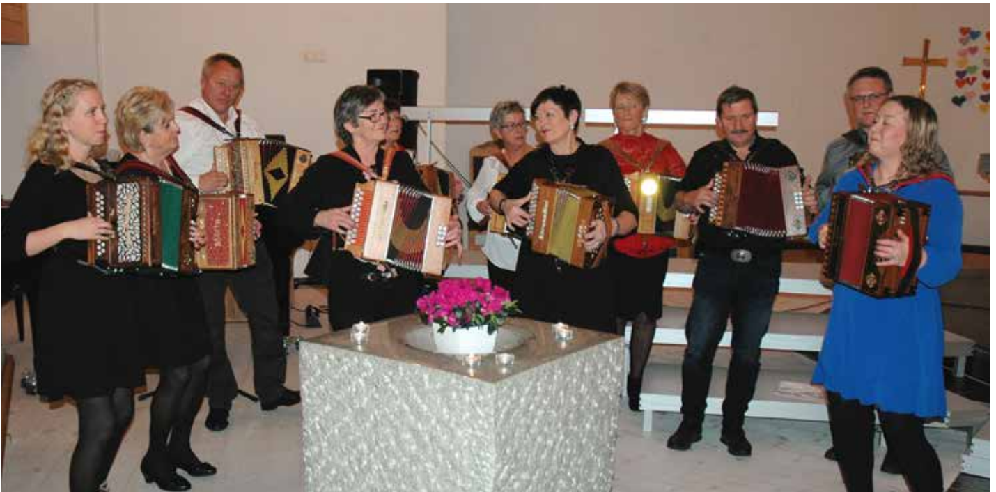
Sund Toraderklubb hadde òg ei eiga avdeling der dei spelte fire songar, m.a. «Rockin' around the Christmas Tree», på julekonserten.