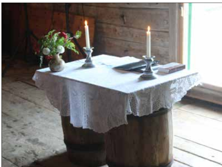
Det provisoriske altaret gjorde nytta si.