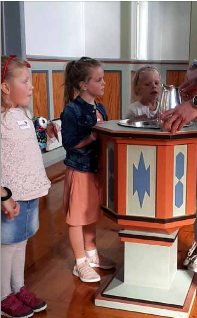
I dåpen blir vi vaska reine og får bli Guds barn.