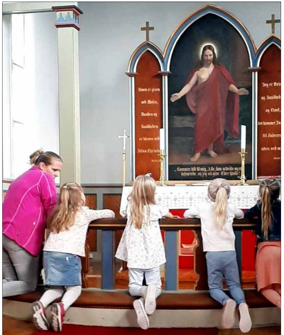
Ved alterringen kneler vi ned for Jesus.