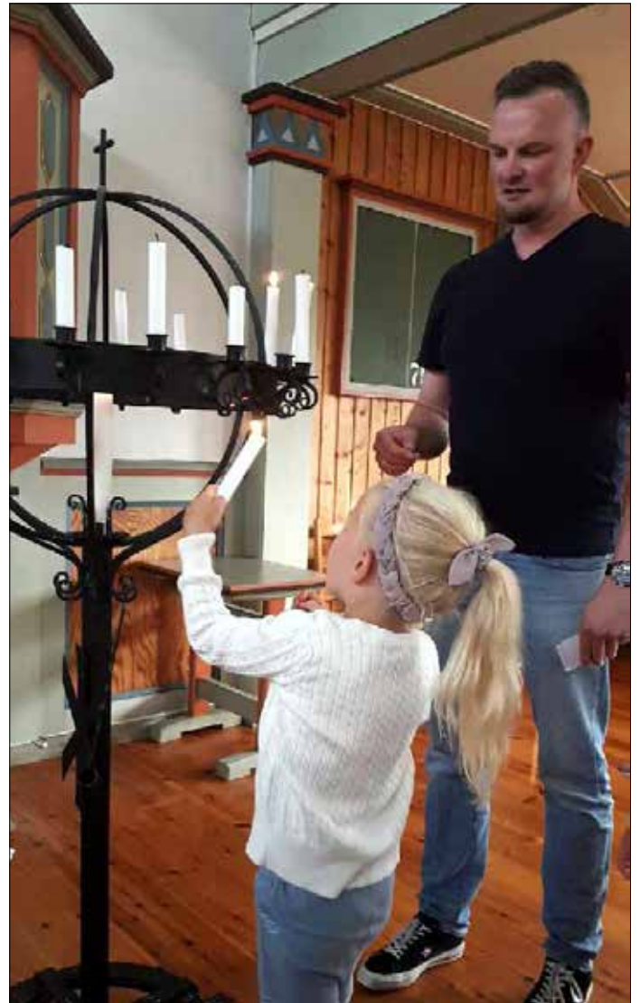
I lysgloben kan vi tenne eit lys for nokon vi er glad i, og be Jesus om å vere med dei.