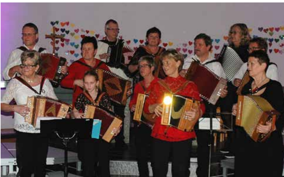
Toraderklubben varta ikkje opp med julemusikk, men fint var det likevel å høyra på dei.

Sund Blandakor hadde fått med seg både Sund Brass og Sund Toraderklubb då dei innbaud til julekonsert i Sund kyrkje 10. desember. Såleis blei det rikeleg av både song og musikk denne kvelden.