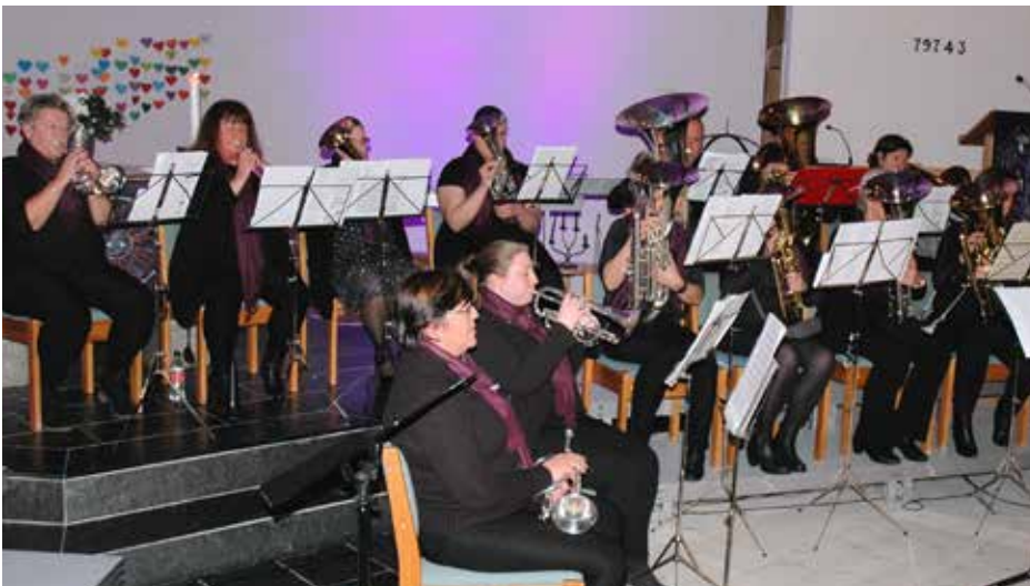
Sund Brass hadde både ei eiga avdeling og spelte til eit par av allsongane.