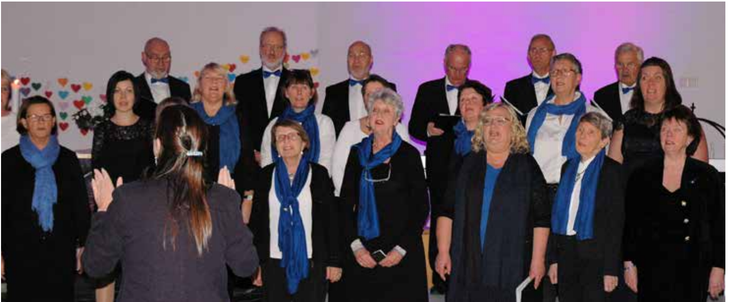
Det var Sund Blandkor som skipa til denne julekonserten i Sund kyrkje. Koret tel mange medlemmer, så berre ein del av dei er med på dette biletet.