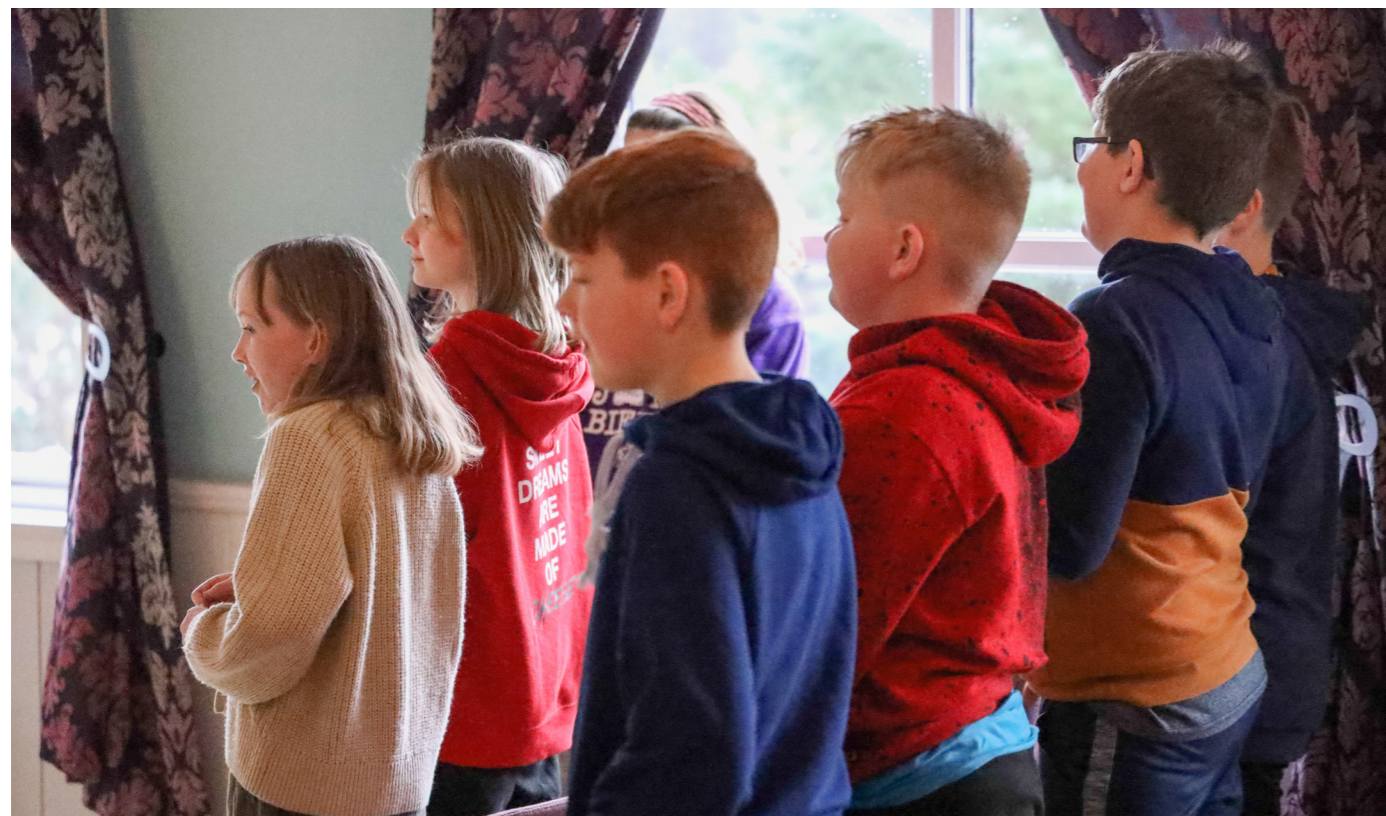
Allsang på bibelsamling

Tekst: Hogne Berland