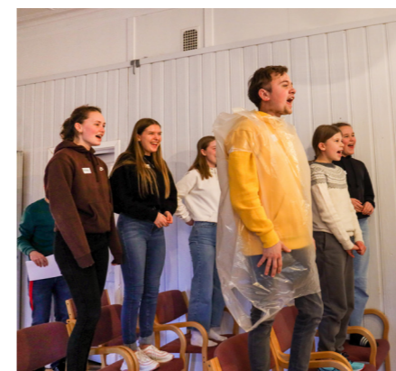
Både ledarar og deltakarar gjer alt i skrikekonkurransen