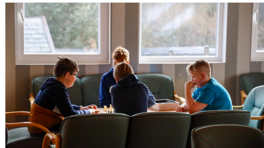
Det blir også tid til litt roleg brettspel i fritida

Det var kjekt å få vera på Skjergardsheimen igjen og vi gler oss til å invitere til fulle leirar med overnatting frå hausten igjen!