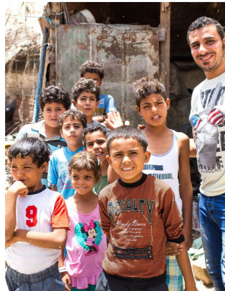
Medarbeidar i Stefanusbarna på heimebesøk