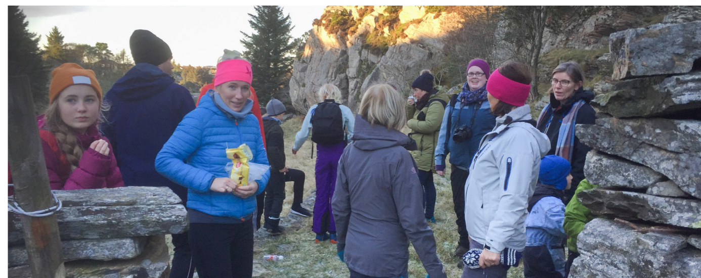
Foldnes kyrkjelyd gjekk kyrkjevegen i 2019

å koma seg til Hjelme. Også frå Hellesøy og Hellesund kunne det vera lettare å ro Hjelmevågen om veret var fint enn å gå gjennom ulendt terreng.