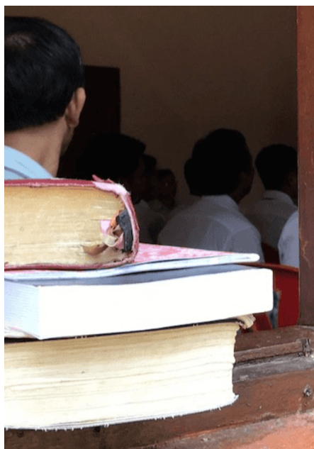
Frå fattige landsbyar kjem kvinner og menn frå tre ulike minoritetar for å gå på bibelskule.