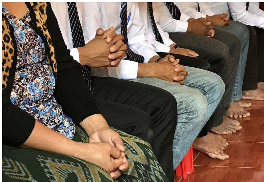
Dei skal bli leiarar av huskyrkjer blant tre ulike minoritetar i Laos.