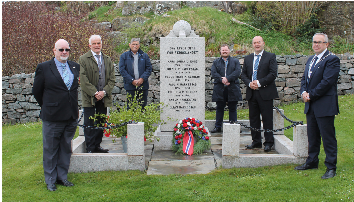
Tekst og foto: Ottar Vik