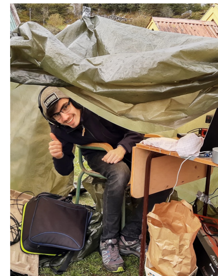
Regnet hindrar ikkje produksjonen.