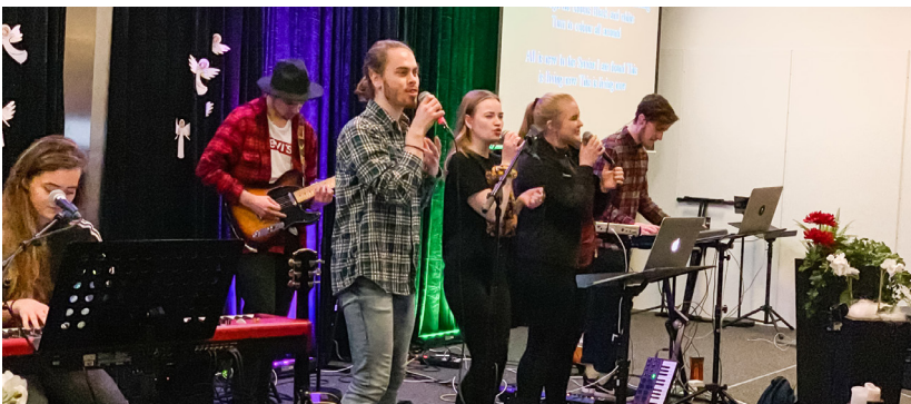
Acta-teamet leier lovsong på Refuel.