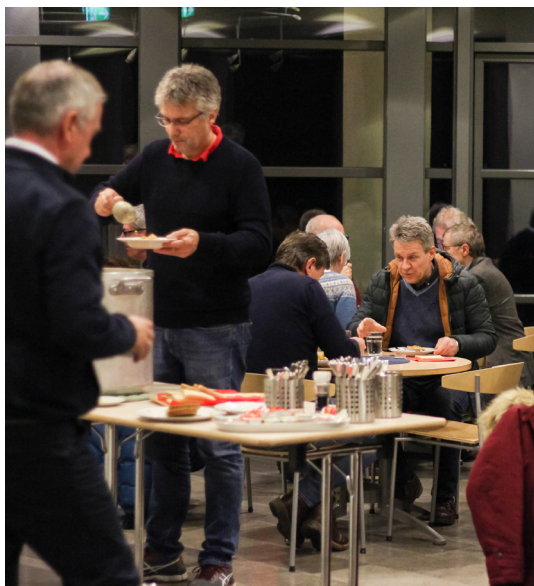
Før kurset vart det servert lagskaus.