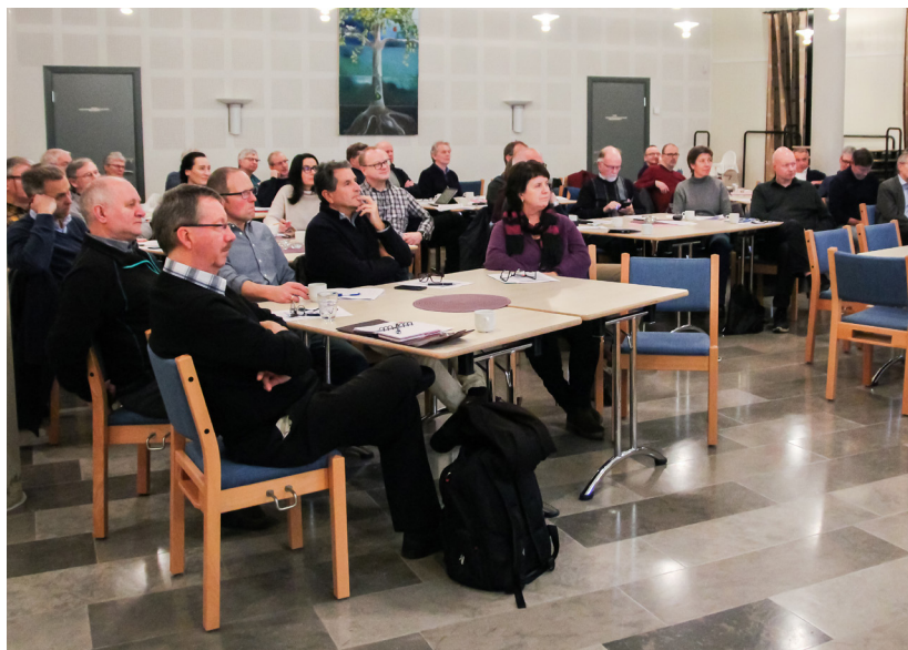
Representantar frå sokneråda i Vesthordland prosti på valkurs.

Onsdag 23. januar var nærare 50 representantar for sokneråda i Vesthordland prosti (Fjell, Sund, Øygarden og Askøy) til stades på eit valkurs i regi av Bjørgvin bispedøme. Samlinga var i Foldnes kyrkje. Her fekk ein innsikt i valreglar og praktiske tilhøve kring gjennomføringa av valet. Den norske kyrkja har ei omfattande valordning, omtrent tilsvarande valordninga for kommune- og fylkestingsval.