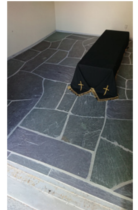
Inne i bårerommet er golvet dekket med skiferstein.