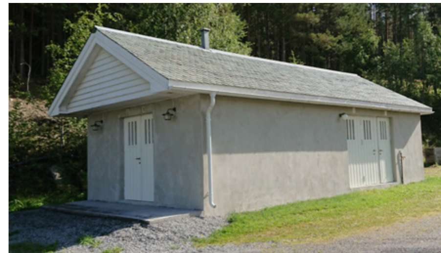
Utsida av bårhuset.