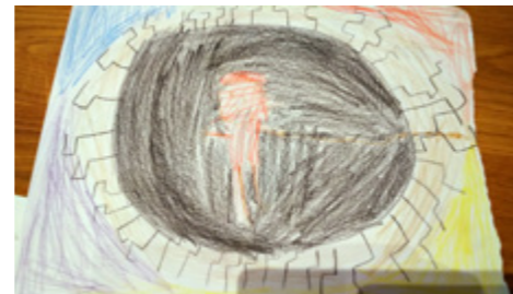
Mørkt i brønnen var det så visst!

Det er difor med stor glede vi har sett i gang eit opplegg for 1. klassingar med familiar der vi fortel nokre av desse store forteljingane. Og så er vona at om dei ein gong i framtida kjem til å kjenne seg som lukka inne i brønnen, hugsar dei forteljinga om Josef, om nytt håp, oppreisning og forsoning.