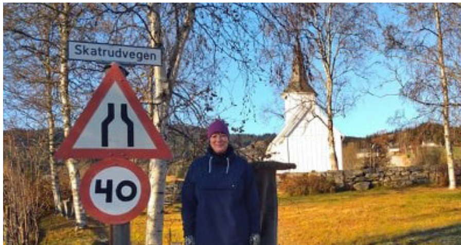
Kyrkja og kyrkjegarden kan hjelpe oss å sakke ned farten.

Kven er ho, den nye kyrkjeverja? Ho går stilt i gangane, kontoret er fylt av ei venleg ro, eit lunt smil er det som møter ein.