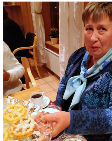
Rosettbakkels må til når livet ruller videre for TorneROSE.