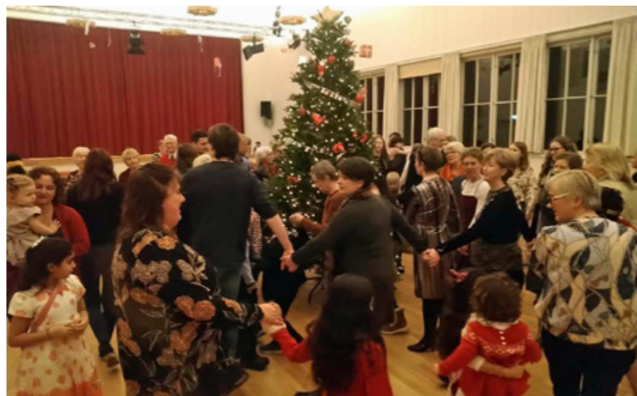
Flott song og gang rundt juletreet.