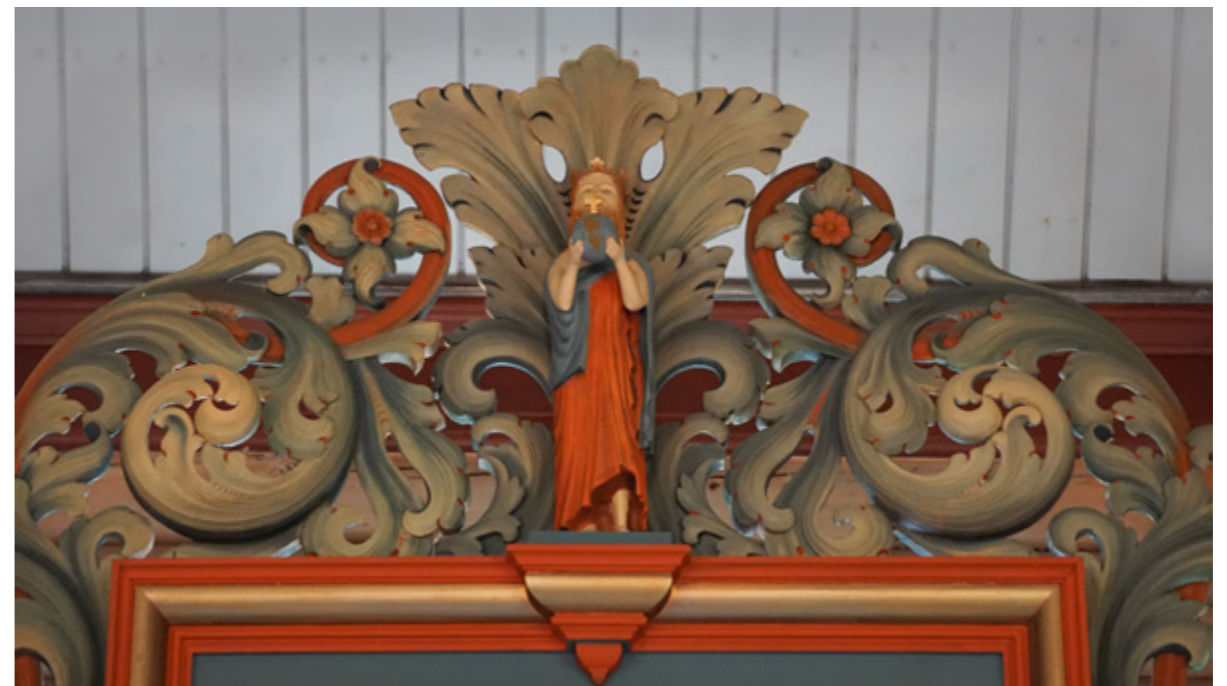
Den sigrande Kristus frå altertavla i Lidar.