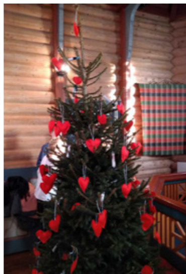
Og vakkert vart det!