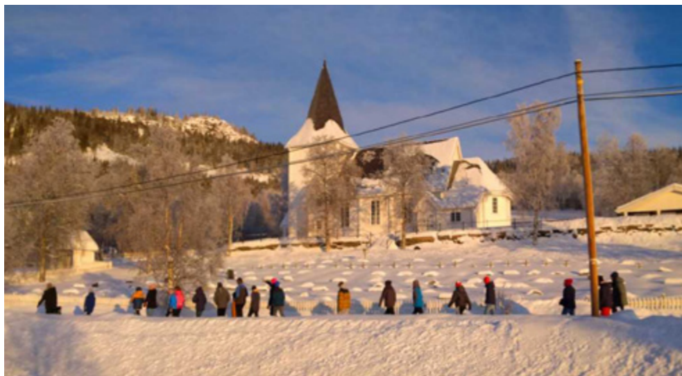
7. klasse på veg til Lidar kyrkje for å pynte juletre!