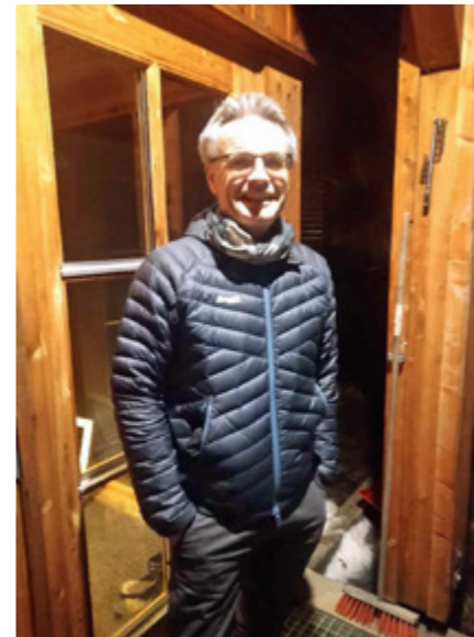
Turen gjekk oppom Løken, og i lyset frå naturvitskapslampa vert konturane skarpe!

- Ja det kan vera svært øydeleggjande for tillitsforholdet, svarar han. Eg føyer til: