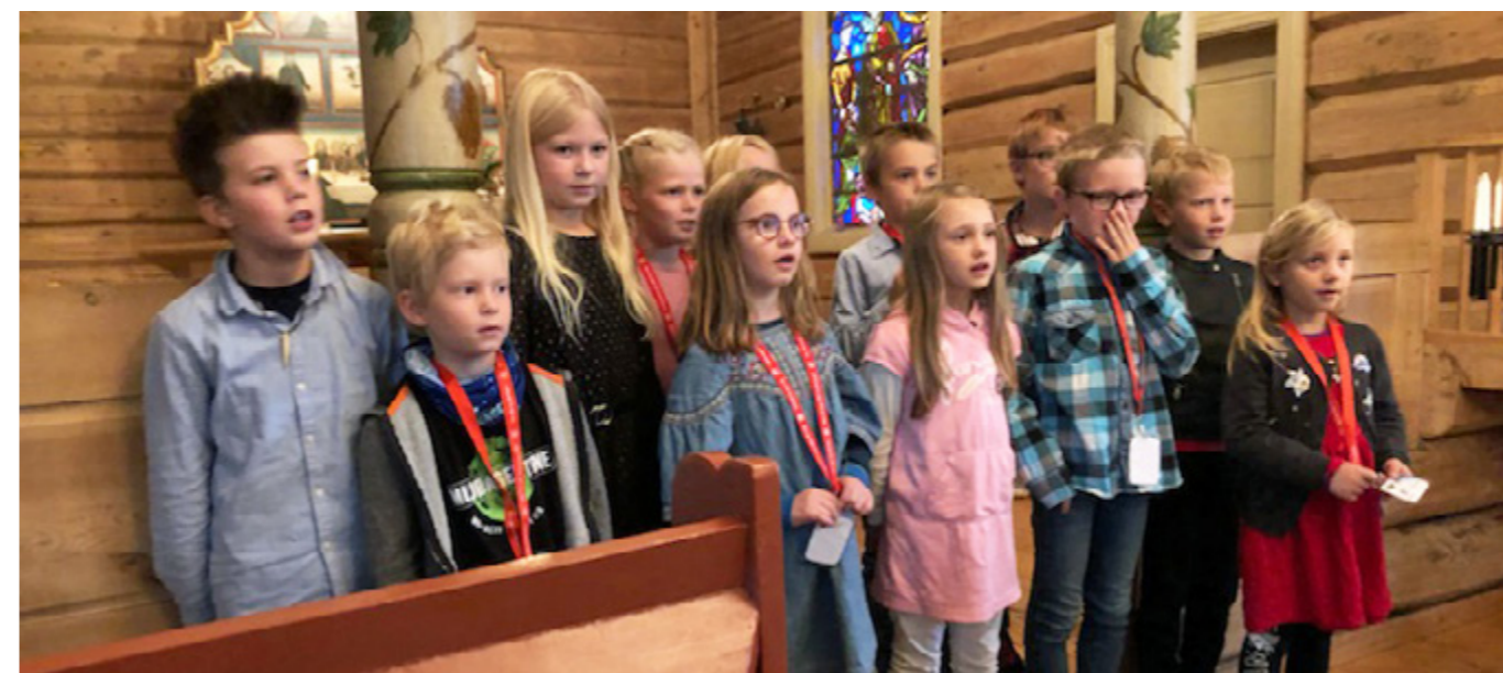
Gloria ved tårnagentene.