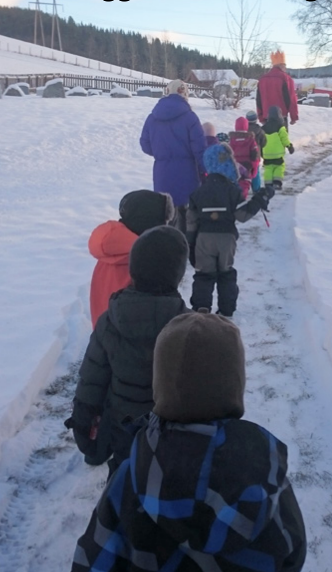
«Barna går foran glad i flokk.»