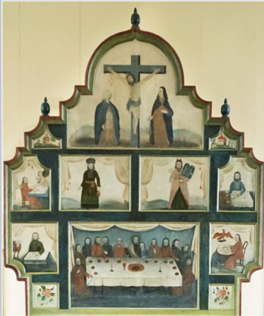
Altartavla i Rogne kyrkje.

Den vakre gamle altartavla som vi framleis kan gle oss over i Rogne kyrkje, er laga av breie ståande plankar med eit listverk som innramming. Tavla har måla felt som viser ulike motiv. Sentralt plassert over altaret er hendinga den kvelden Jesus innstifta nattverden. På venstre side ser vi evangelisten Lukas, og til høgre for nattverdsscena sit Johannes. Desse har bøkene sine klare der dei har skrive ned forteljingane. I felte ovanfor ser vi Moses og broren Aron med