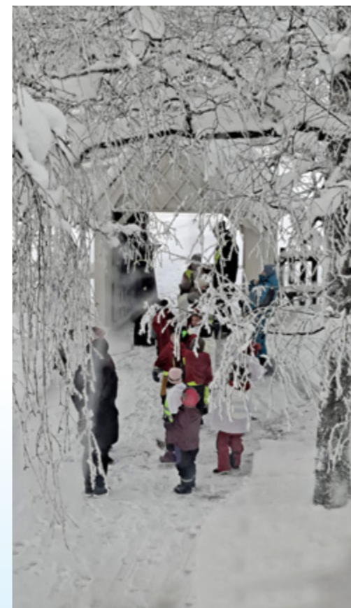
Rogne barnehage på veg inn gjennom porten på julevandring sett fra tårnet.