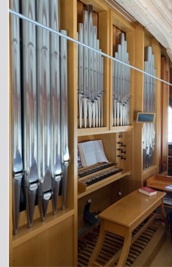
Fasade orgelet i Lidar kyrkje.

Manual 1: Gambe 8', Prinsipal 8', Rørfløyte 8', Oktav 4', Waldfløyte 2', Sesqualtera 2 fag, Mixtur 3 fag Manual