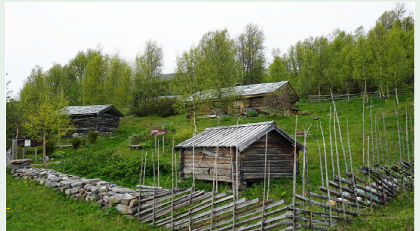
Liastølen, ei grøn lunge på Beitostølen.

Liastølen (3/148). Opphavleg sto Liasælet på stølen til garden Søre Lien. Sidan sumaren 2002 har stølen vore ein open møteplass for tradisjon og levande kultur midt i sentrum av Beitostølen. Gjennom kulturformidlinga på Liastølen vert både den materielle og den immaterielle kulturarven ivareteke og formidla til målgrupper som inkluderer ikkje berre turistar, men også bygdefolk og deltidsbebuarar i Øystre Slidre. Liasælet er om lag tre hundre år gammalt, og representerer ein toroms byggeskikk med skut i mellom. Tømmeret er av svært grove stokkar og er øksehogde og gjev eit svært solid inntrykk. Sælet hadde torvtak fram til 2001, då det blei flytta dit det står no. No har det skifta til villheller av skifer frå Øystre Slidre. Liastølen kulturlag leiger tomt på Beitostølen ut 2023.