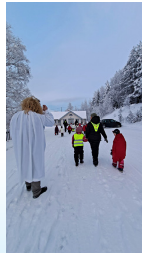
Ein engel takkar Rogne barnehage for besøket.