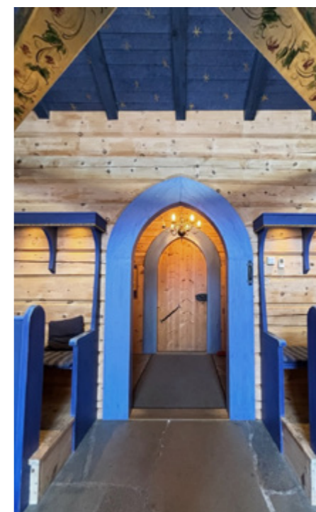
«Troens dør og håpets bue» i Lyskapellet på Beitostølen.