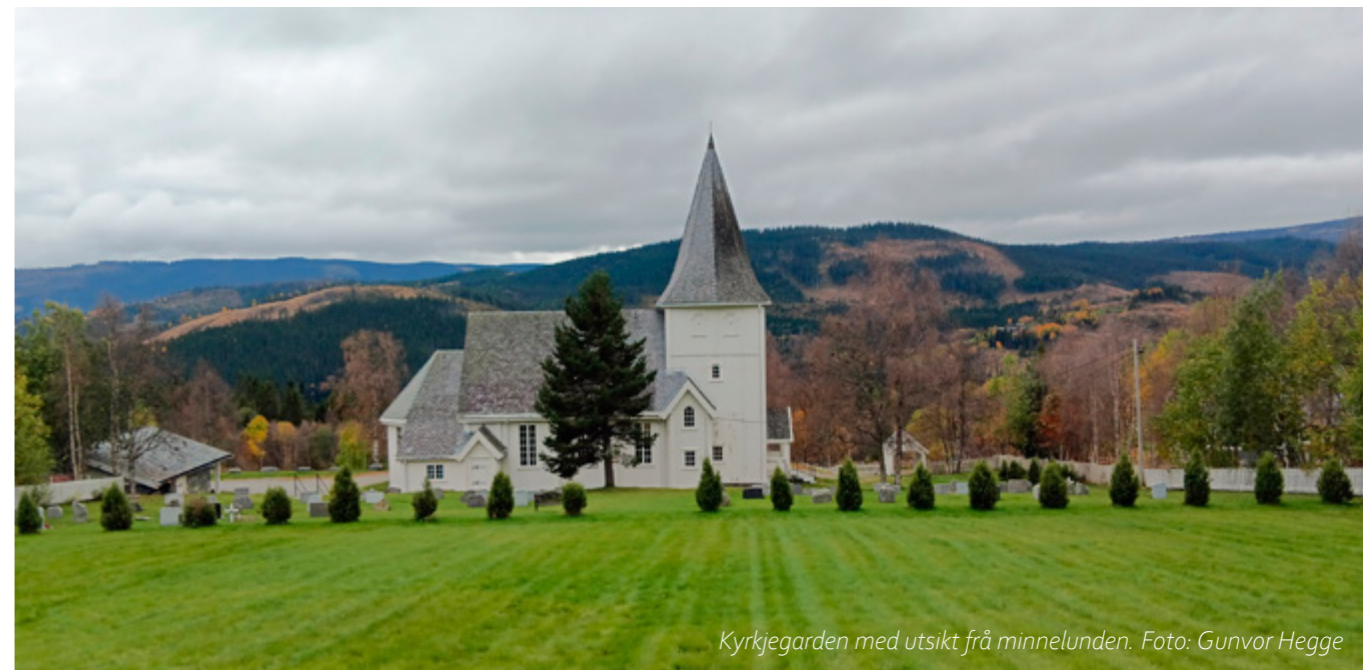
Kyrkjegarden med utsikt frå minnelunden.

På slutten av 1800-talet byrja arbeidet med å etablere ein gravplass i Lidar-området. I 1900 vart det løyvd pengar, og ei tomt på 2,5 mål vart kjøpt frå Li. Gravplassen vart offisielt vigsla i 1902. Det er litt usikkerheit rundt den eksakte dato, med nokre kjelder nemner 5. oktober og andre 6. november.