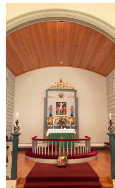
Kordelen i Nord-Etnedal kyrkje.