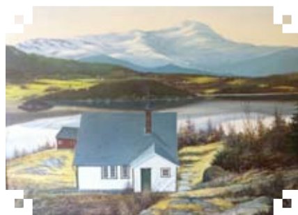
Helsing frå Klara Rosnes, radværing sidan 1955

Det nærmar seg advent og jul, og eg vil ynskja alle radværingar og andre som les Radar ei god adventstid og ei velsigna julehøgtid.