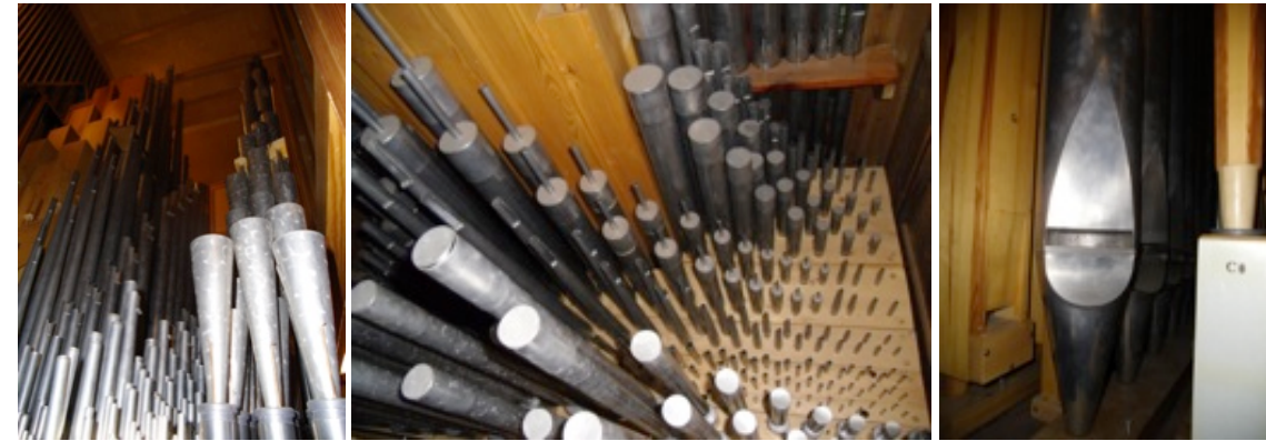
Alle dei over 2000 pipene i orgelet må rensast

I 2009 gjennomførte soknerådet første delen av eit stort oppussingsprosjekt for å sikra orgelet si framtid. Alle dei gamle elektroniske komponentane vart skifta ut og spelepulten bygd om. Orgelet fekk eit nytt registreringsanlegg som gjorde instrumentet mykje meir fleksibelt. Også ergonomisk sett er den ombygde spelepulten ei stor forbetring.