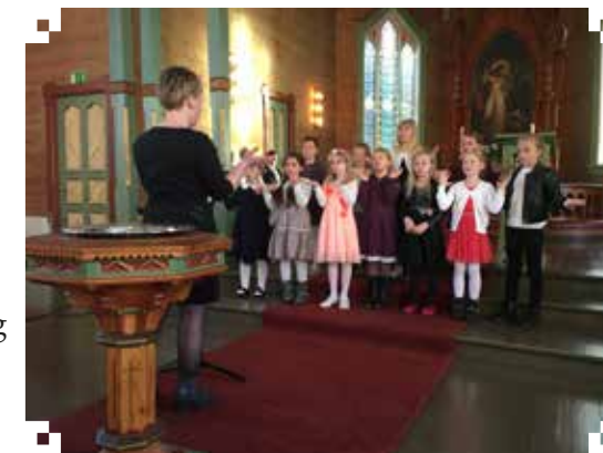
Sæbo barnekor var med og song på festgudstenesta søndag.