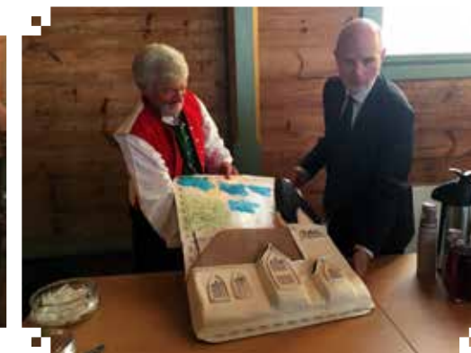
Den store jubileumskaka.