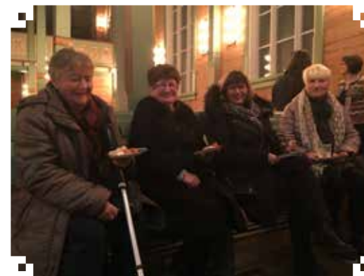
Godt med "kyrkjetapas"!