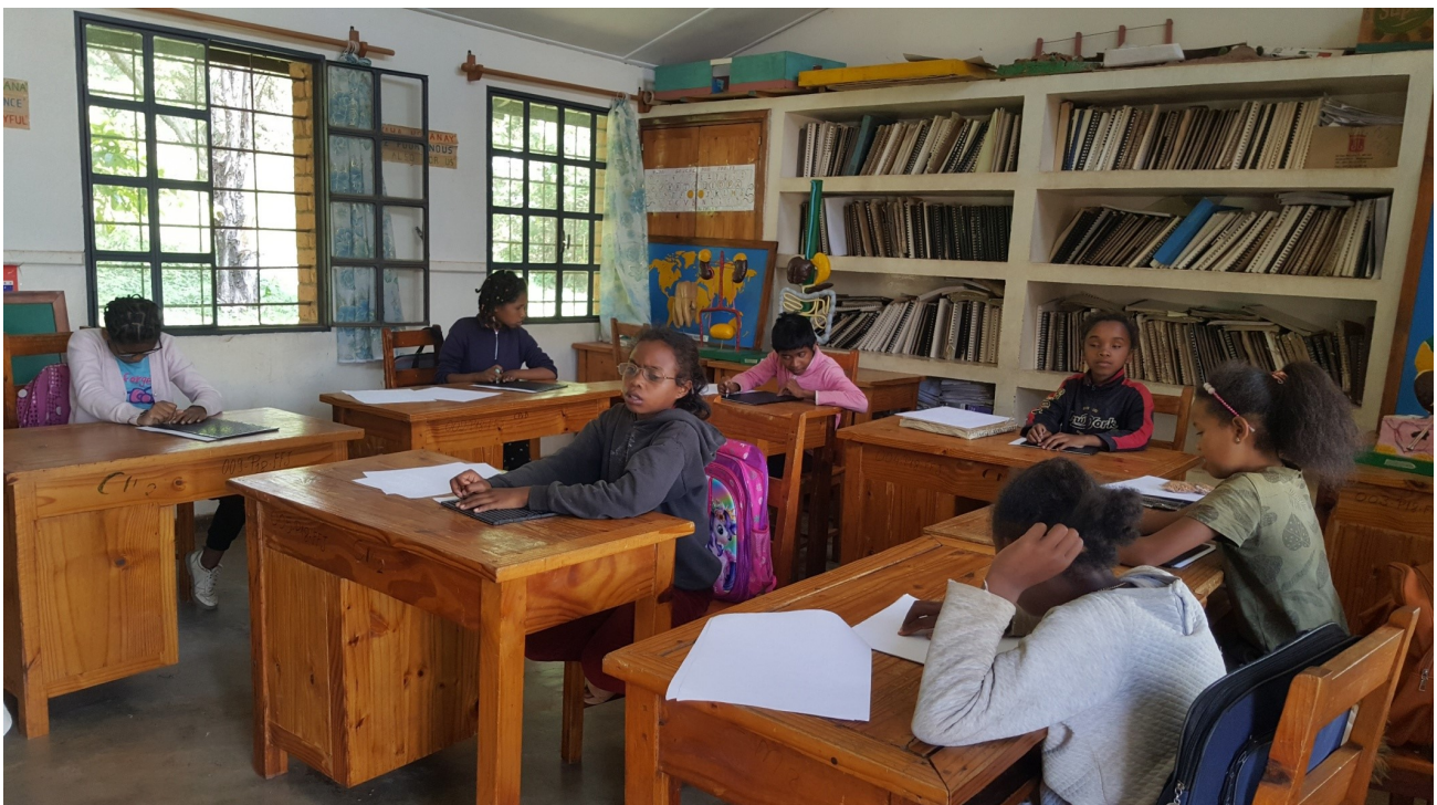
Klasserommene er lyse og elevene får en god undervisning.

NMS har i mange år støttet blindeskolen i Antsirabe, og skolen har gjort et stort arbeid, men i skoleåret 2022-2023 fikk bare 75 blinde barn tilgang til skolen. Hvor mange blinde barn ble etterlatt? Det vet ikke skolen. Myndighetene vet ikke heller. Hvem vet? Tusenvis av barn med nedsatt funksjonsevne er overlatt til seg selv i samfunnet. De er fratatt sine grunnleggende menneskerettigheter, rettigheter som alle snakker om på store banner, i radio, på TV og i aviser.