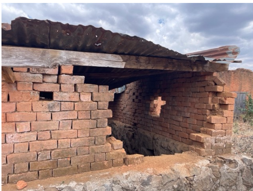
Det sammenraste fjøset skal en gang settes i stand igjen - og kanskje bli til en studentbolig. Imens slipper korset i veggen solstrålene in...