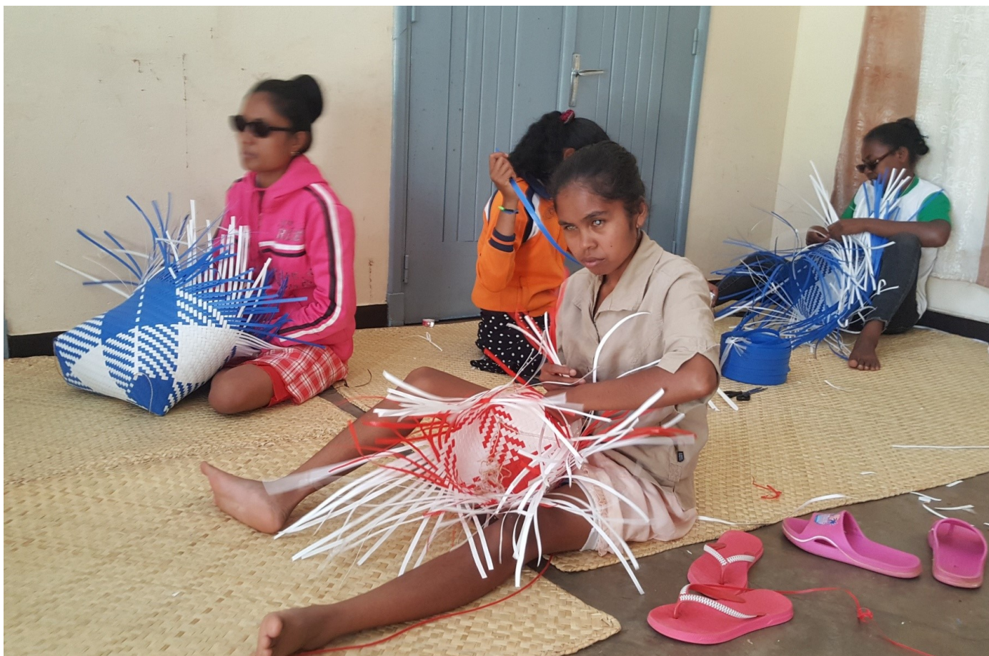
Korgene barna lager blir solgt for å skaffe skolen litt inntekt.

Utdanning generelt er akterutseilt, og bare noen få er opptatt av skolene. På Madagaskar er det millioner av barn som mangler tilgang til utdanning. Det er dobbelt så vanskelig når man kommer fra et avsidesliggende område og samtidig har en funksjonshemming. Mangelen på tilgang til utdanning er et alvorlig problem på Madagaskar og fører til en sirkel av fattigdom, ulikhet og diskriminering. Uten tilgang til utdanning har man ikke mulighet til å tilegne seg de ferdighetene man trenger for å få en god jobb eller starte en bedrift. Flere enkeltpersoner og organisasjoner jobber for at barn skal få tilgang til utdanning gjennom tiltak som å skaffe lærebøker, bygge nye skoler og utdanne og utruste lærere, men staten svikter en av sine viktigste oppgaver. Mange barn med nedsatt funksjonsevne har ikke tilgang til utdanning på grunn av mangel på støtte, materiell som Braille-bøker og tekniske hjelpemidler, og ikke alle lærere har kompetanse til å gi den nødvendige støtten til elever med nedsatt funksjonsevne. Skolevesenet er fortsatt langt unna å være inkluderende. Dette understreker behovet for økte investeringer i ressurser og støtte til barn med funksjonsnedsettelse, slik at de kan nå sitt fulle potensial.