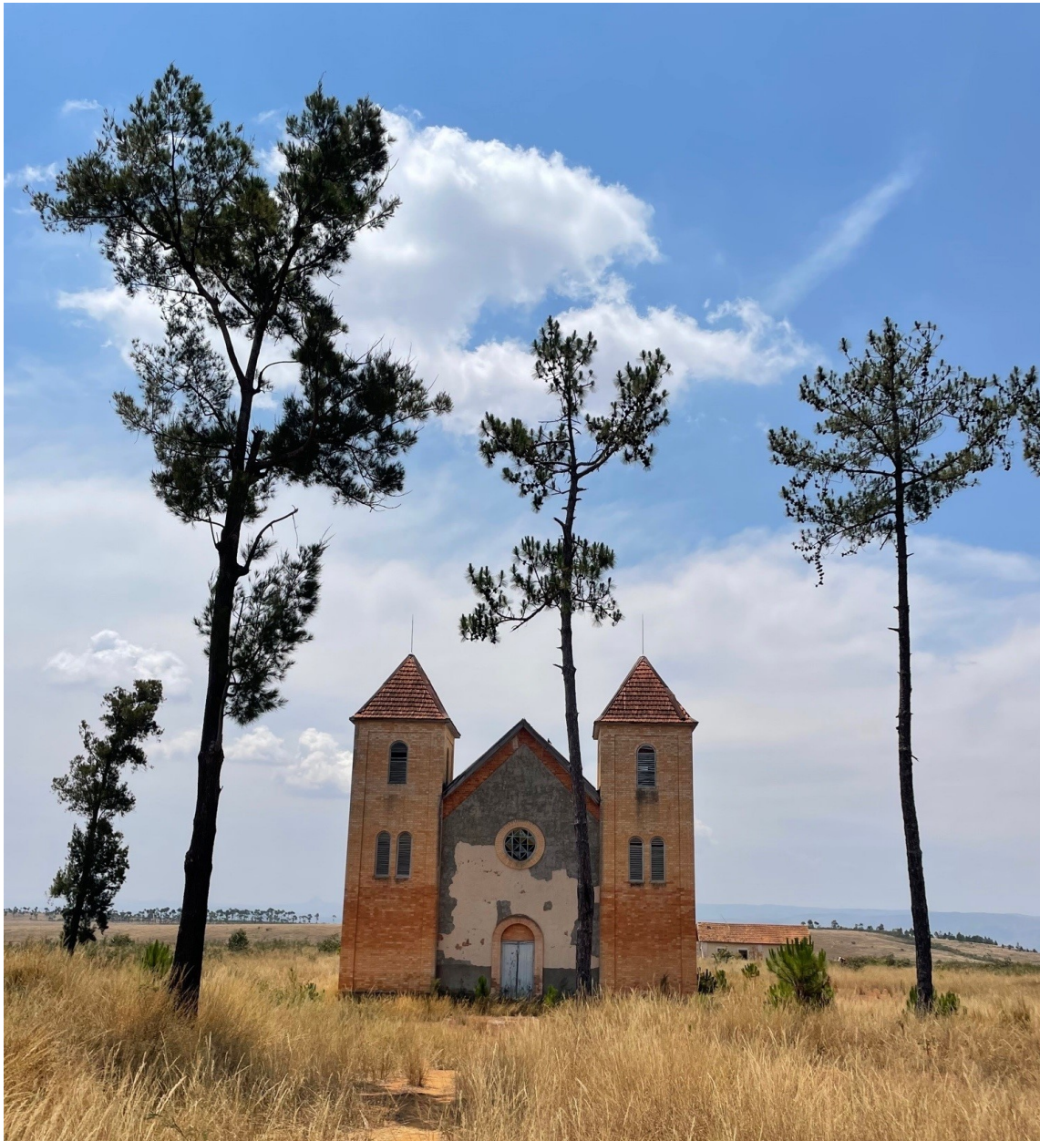
Den flotte kirken har ikke vært i bruk på mange år. Den er for stor til en såpass liten forsamling. Dessuten er taket lekk flere steder.