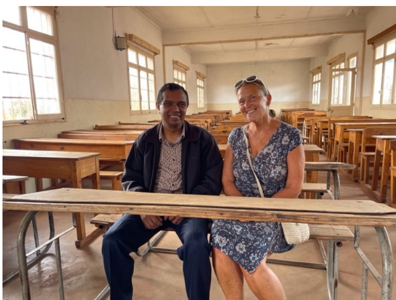
Rektor og skribent på første rad i klasserommet.

Når vi besøker skolen, har ikke semesteret kommet i gang ennå, men det er rett rundt hjørnet. Midt i oktober er skolestart på Madagaskar. Da ventes 75 nye første-års studenter. Tredje-års kullet teller nå 85 studenter, hvorav det er 23 kvinner og 52 menn. Studentene som går her, har et høyt kunnskapsnivå. Bibelen er noe de fleste kjenner svært godt. Men personlig egnethet er også viktig. Det er stor prestisje i å være pastor på Madagaskar.