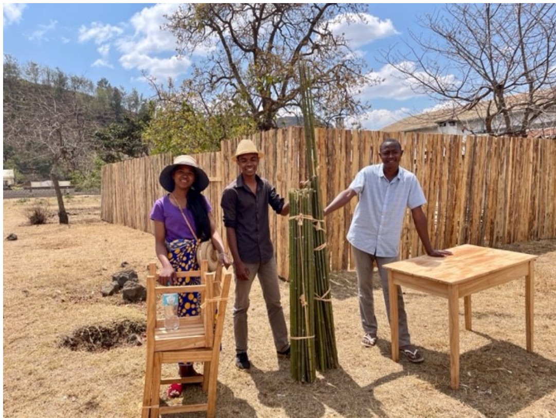
Tre av de nye studentene bærer på møbler de hadde kjørt, de to til venstre hadde nettopp giftet seg.