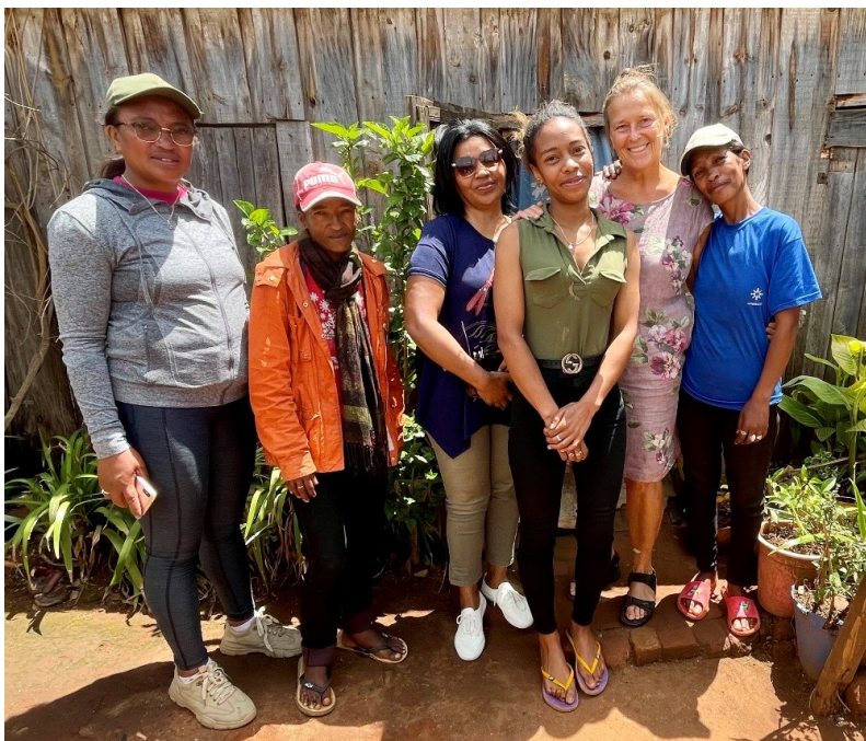
Alle må med, både tanter, prosjektleder, hovedpersonen selv, skribent og mor.