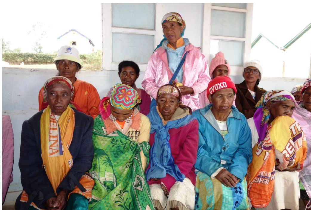
Noen av de aktive Remafi-kvinnene som forteller om oppgavene sine.

Gruppen er svært aktiv for å skaffe penger i gruppekassen: de kjøper kaffe, ris og bønner når de er billige og selger dem etterpå, når prisene har steget. De har også griser. REMAFI-gruppen har tette bånd seg imellom og de besøker hverandre ved spesielle anledninger, og når noen er syke eller dør. De var også et godt eksempel under koronapandemien – alle ble vaksinert mot korona to ganger. På Madagaskar var det mange som var svært skeptiske til vaksinasjonen, og bare noen få benyttet seg av dette tilbudet.