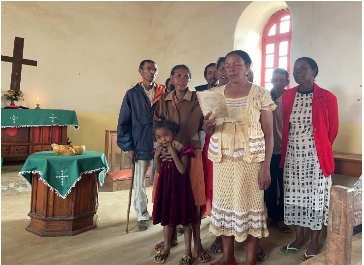
Kirkekoret bidrar - også noen sittende fra forreste rad, da føttene er så ødelagte at det gjør det vanskelig å stå og gå. Men stemmeprakten er det ingenting i veien med.

I 1887 startet NMS sitt arbeid blant de spedalske ved å opprette spedalskehjemmet Ambohipiantrana i Antsirabè. Navnet betyr Barmhjertighetens by, og hjemmet lå på andre siden av den lille innsjøen nedenfor der Lovasoa ligger i dag. Dette var det første diakonale arbeidet til NMS, og også et av de første bistandsprosjektene i Norges historie. Frankrike var på den tiden okkupasjonsmakt på Madagaskar og ønsket ikke ha de spedalske i byen. Frykten for smitte var stor. NMS måtte derfor finne et nytt sted. Valget falt på Mangarano, cirka 15 kilometer sørvest for Antsirabe, hvor de etablerte en lepralandsby. Den sto ferdig i 1919. Det ble bygget sykehus, boliger, skole og en stor, flott kirke. Det ble også opprettet et barnehjem for de nyfødte barna, i håp om at de skulle unngå å bli smittet. Det var stort sett enslige, kvinnelige misjonærer og diakonisser som bodde og viet sitt liv til arbeidet på Mangarano.