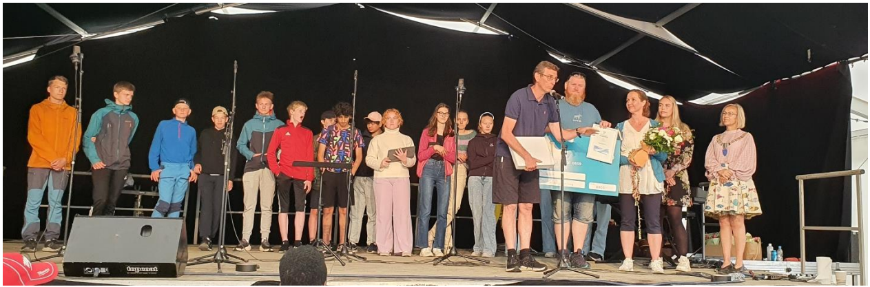
Bilde fra utdelingen av kulturprisen.

Vi er stolte og glade for at Salangen kommunes kulturpris i 2022 ble tildelt voksenlederne i SalSing.