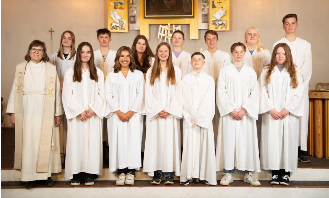
Konfirmantene som ble konfirmert i 2022

Høsten -22 var det 22 konfirmanter hvorav 7 er med i SalSing. Det har vært konfirmantweekend sammen med Lavangen og undervisning i løpet av høsten. Konfirmantene var med på lysmessa.