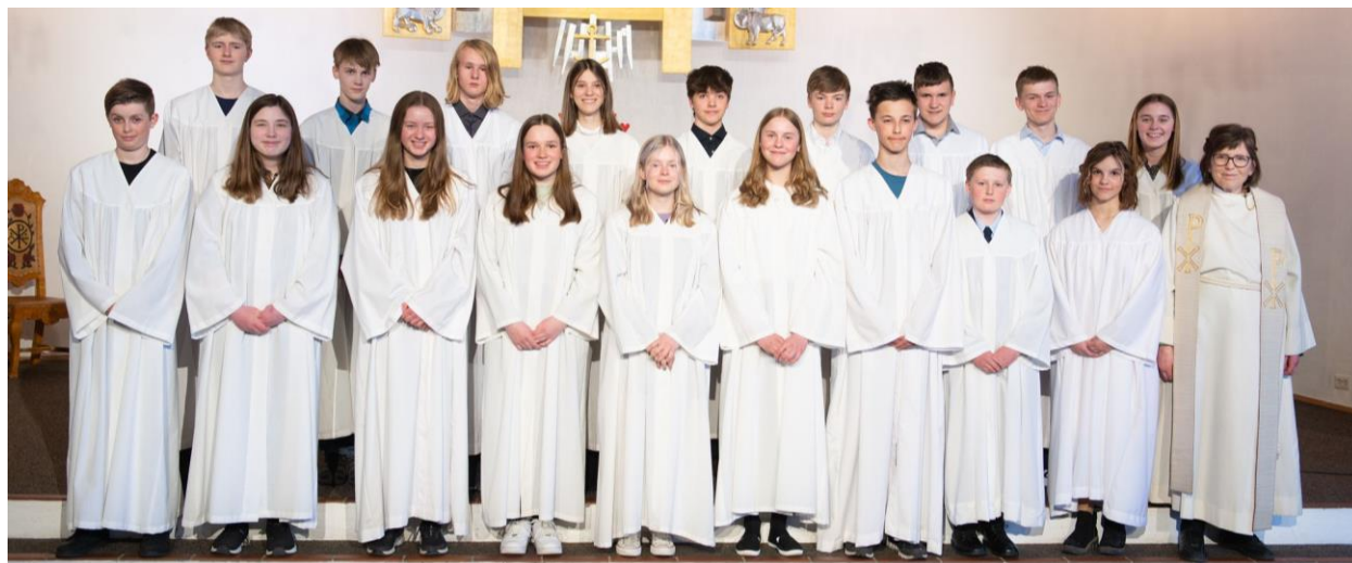
Konfirmantene som ble konfirmert høsten 2021

Undervisningen varierte mellom undervisning rett etter skole, aktivitetsgrupper som friluftsgruppe, samtalegruppe og besøke eldre, lørdagsundervisning, delta på fasteaksjon og delta på gudstjenester. På grunn av koronasituasjonen ble det en digital fasteaksjon der konfirmantene var med på å gjøre den kjent. Av samme grunn ble det heller ikke midnatta for konfirmantene i 2021. Koronasituasjonen var også årsaken til at konfirmasjonen ble utsatt til høsten. Heldigvis kom de seg på konfirmantweekend høsten 2020 selv om det var korona.