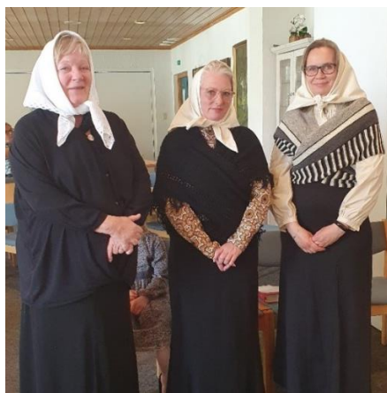
Pene damer kledd som i gamle dager