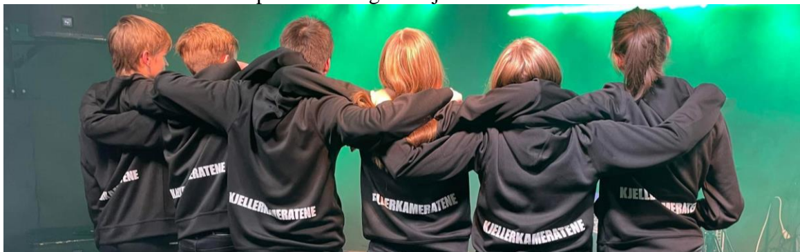
Bandet kjellerkameratene, et av to Salsing band

Nå i vinter har SalSing sunget utenfor sykehjemmet og i sentrum på Lucia-dagen, og på kommunestyremøtet. Vi deltok på Lysmessa og sang på Jubileumsgudstjenesten da kirken fylte 40 år. Vi har hatt solistnummer på Julaften og i romjula.