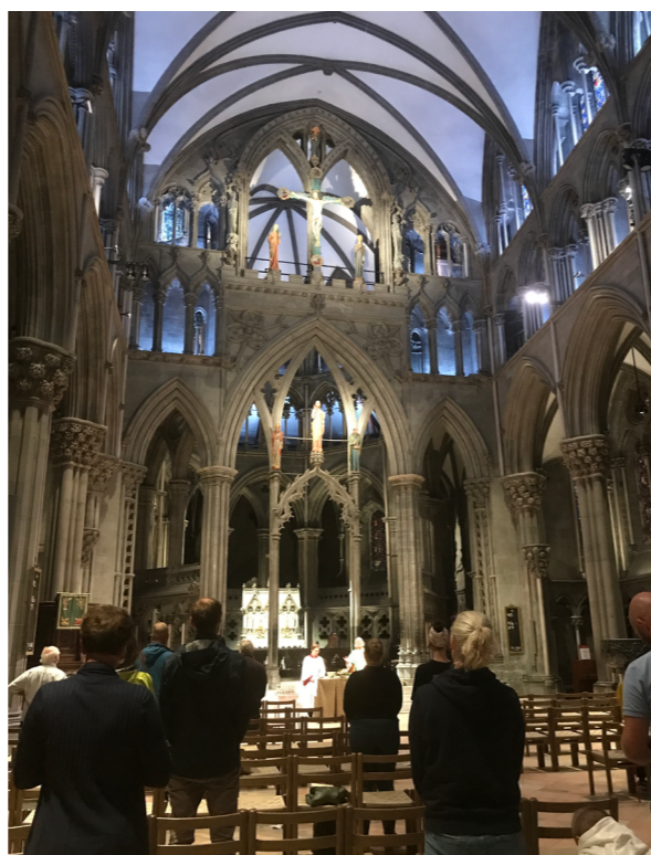
Fra kveldsmesse i Nidarosdomen i Trondheim sommeren 2021.