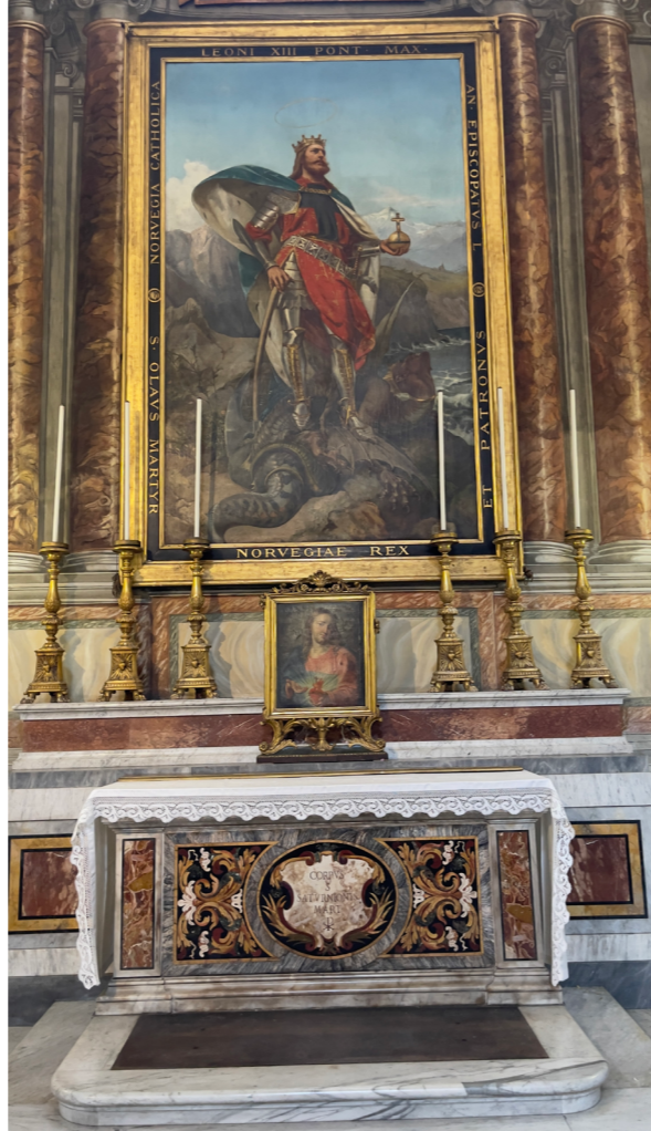
Fra Basilica dei SS. Ambrogio e Carlo al Corso i Roma sommeren 2022. Maleri av Kong Olav Haraldson ved St. Olavsalteret der.

Det er vel rundt disse store kategoriene vi tenker ulikt, noen ser Gud i glassmalerier og gullkors, andre ser stormannsgalskap, noen ser evigheten i ei gravstøtte, andre savn og sorg. Og uavhengig av hvordan vi