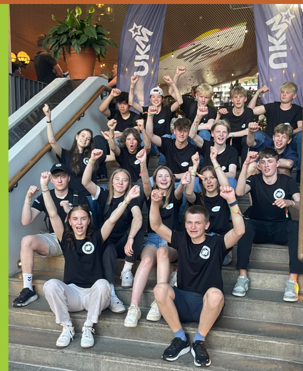
Begge bandene gikk videre til UKM-festivalen i Trondheim, der de fikk opptre med låtene sine i Olavshallen.

Disse tre er Tor Magnus Østvik, Hans Erik Børve og Stine Anker Myr-