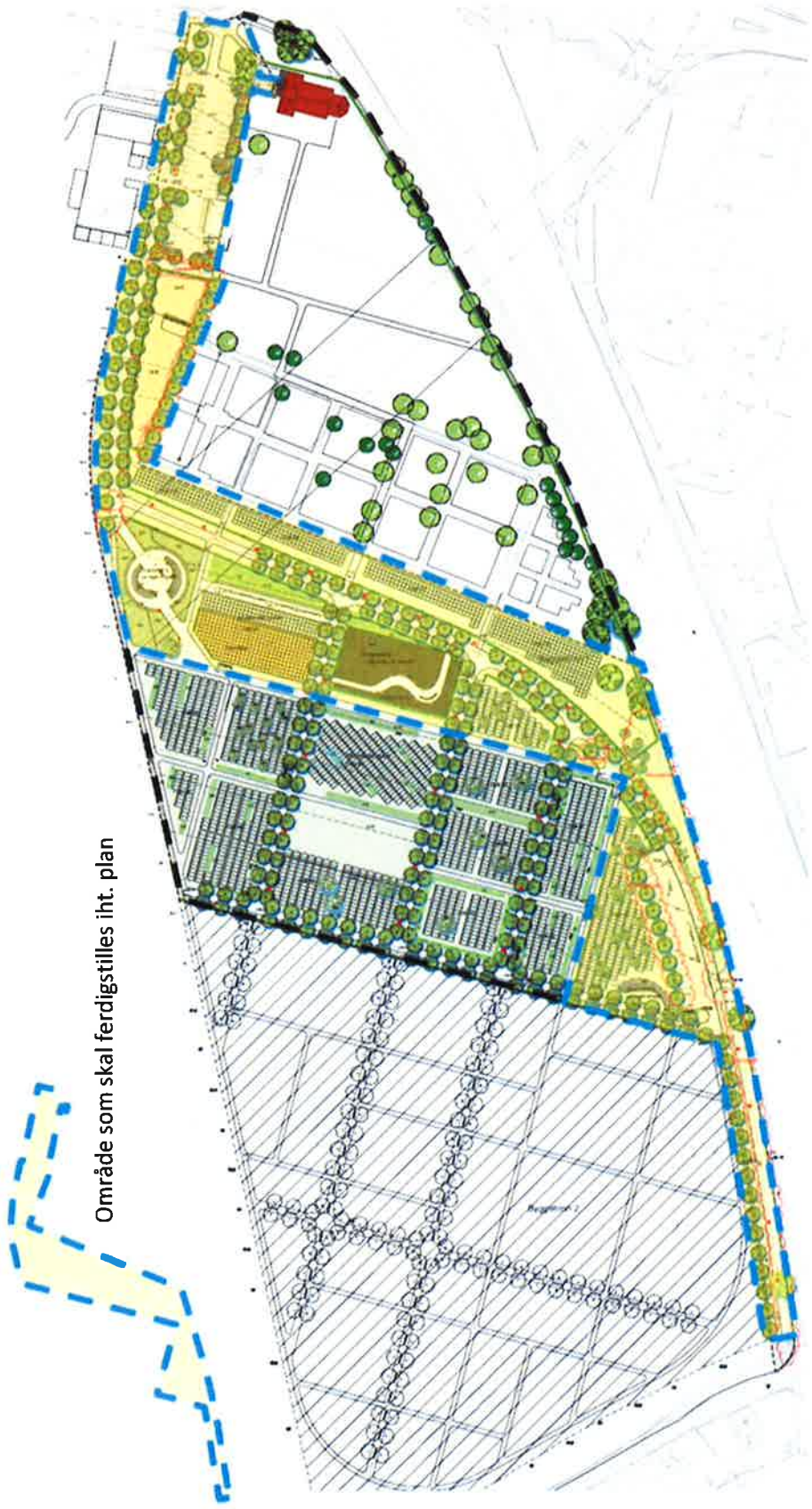
Område som skal ferdigstilles iht. plan