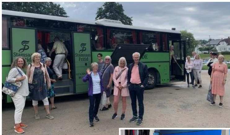
Glade mennesker på tur med Stamsaas-bussen.

Turen gikk til Håpets katedral på Isegran der vi fikk grundig og god guiding om både visjonen og prosessen i arbeidet med katedralen. Bærekraft, fellesskap, håp, sirkulærøkonomi, samhandling på tvers av skillerlinjer er noen av stikkordene.