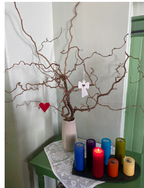
Dåpstreet i Soli kirke og et lignende er på plass i Holleby kirke.