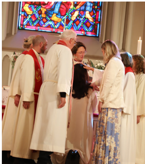
Håndspåleggelse og bønn er en viktig del av ordinasjonshandlingen.

– I tillegg har jeg bygd på kompetanse underveis, blant annet en master på MF vitenskapelig høy-