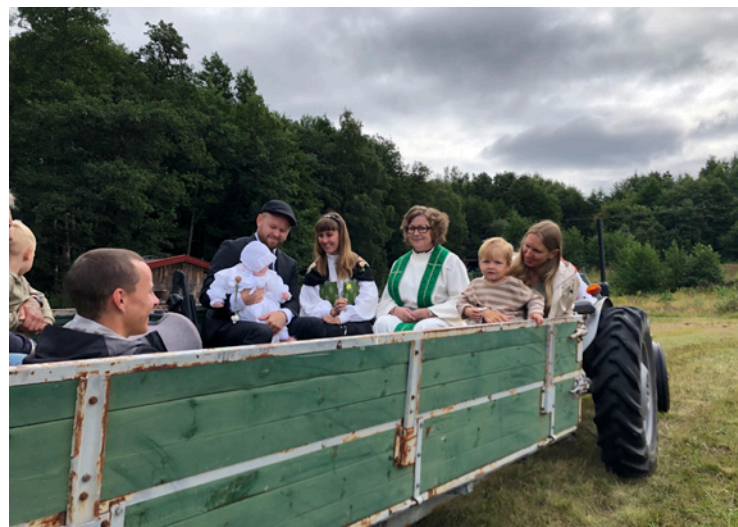
En tur med Gråtass var populært for både gammel og ung.