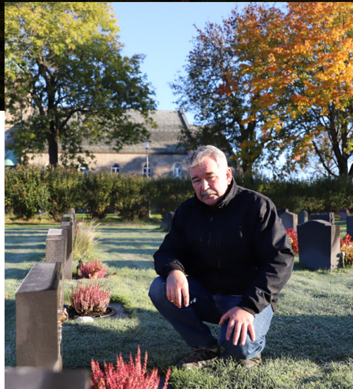
Lystenning på grava kan gi trøst, håp og ro for etterlatte.

Det utviklet seg derfor en egen dag da man mintes alle «helgener» som på en eller annen måte hadde