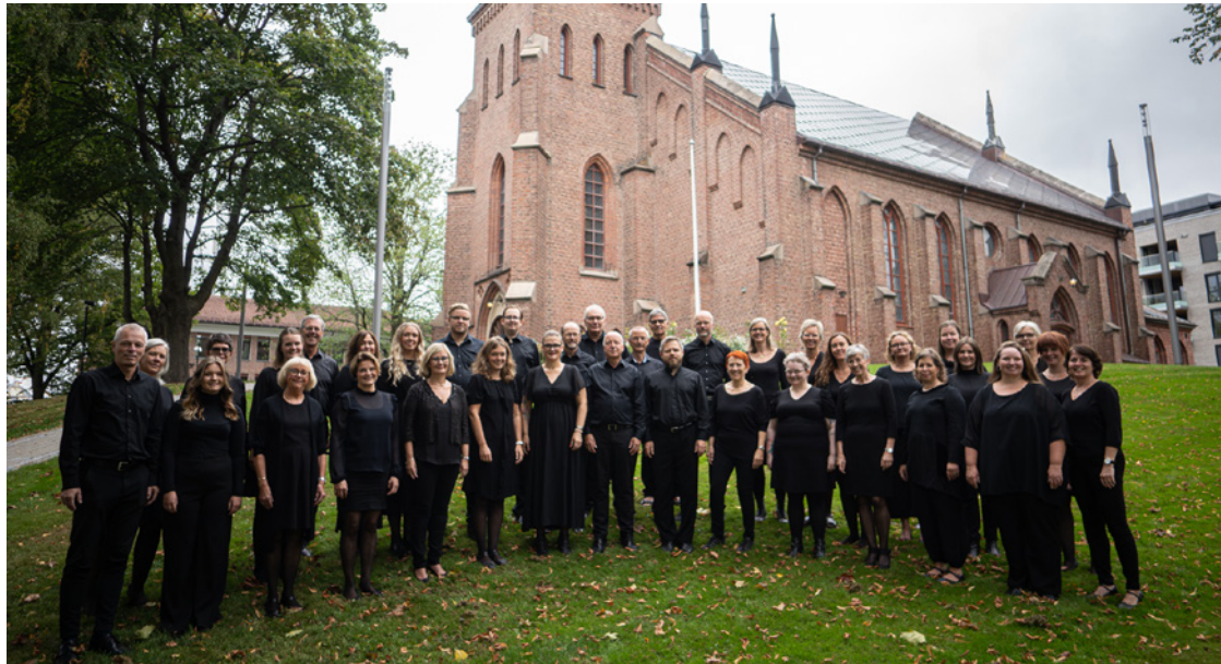
Sarpsborg Kammerkor hviler slett ikke på laurbærene, og går travle tider i møter med ikke mindre enn tre konserter i november.

I løpet av sitt virke, har koret gledet tilhørere med vakker kirkemusikk og flere årlige konserter. Carl-Andreas har også ledet koret