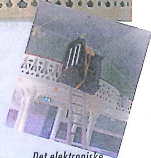
Det elektroniske orgel på vei ned fra galleriet.

Fellesrådet innvilget 100000 kr, og menigheten skaffet til veie 80000 kr ved pengeinnsamlinger og konserter med lokale krefter. Det nyrestaurerte orgel med 216 orgelpiper ble innviet 9.des. 2007.