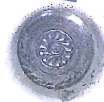
Det gamle dåpsfatet som ble brukt i Skjebergdalen fram til 1959

Alle dåpsbarn i Skjebergdalen har de siste årene fått en dreid og malt trelysestake etter modell av døpefonten. Disse lages på dugnad på Grinerød.