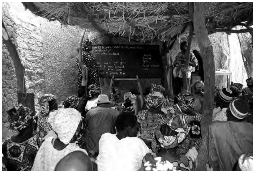
Lese- og skrivekunnskaper bidrar til verdig liv. Mali.

Det Norske Misjonsselskap (NMS) ble stiftet i Stavanger i 1842 og er en selvstendig organisasjon innenfor Den norske kirke. Bildet av misjon som en bevegelse for å bringe evangeliet fra nord til sør i verden, stemmer ikke lenger. I sør er det mange kirker som har stor vekst. I Den gassisk lutherske kirken (FLM) etableres det f.eks. i gjennomsnitt én ny menighet hver uke! Det motsatte er ofte er tilfellet på vårt eget kontinent. Samtidig vet vi at verdens goder og res-