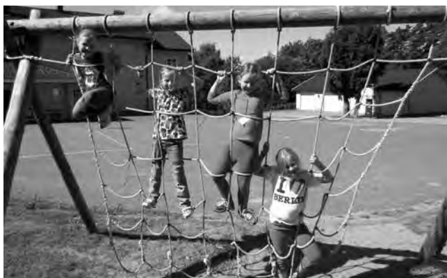
Globusagenter - ett av NMSU's leirtilbud på Stenbekk Misjonssenter.

Vi støtter også lokale kirker i utdanning av prester og lekfolk