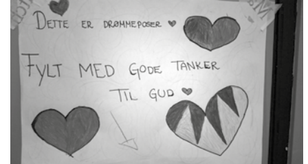
Agenter forbereder bønnevandring til gudstjenesten.