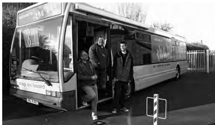
"The Bus" er et av kirkens lavterskeltilbud for å komme i kontakt med ungdom i Carlisle bispedømme. England.