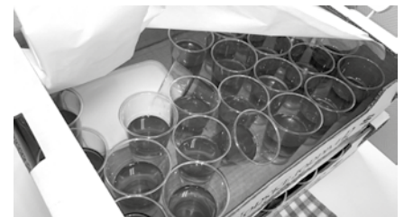
Dessert og langbord: En hel dag i kirken med mange aktiviteter øker appetitten. Det ble servert både lunsj og middag med dessert til alle agentene og agentlederne.