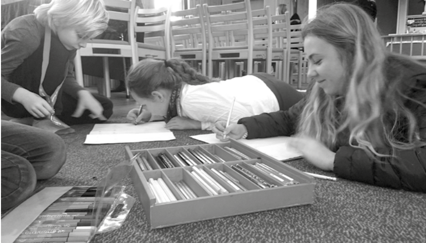
Agenter forbereder bønnevandring til gudstjenesten.