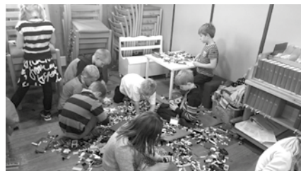
Lego og perler: Mellom agentoppdragene ble det tid til å gjøre valgfrie oppdrag som å perle symboler, bygge med lego og tegne hemmelige men hyggelige kort til hverandre

Noen var tårnagenter for første gang og kanskje ekstra spente på møtet med en lang dag i kirken. Andre hadde både globusagentsamlinger og tårnagentsamlinger bak seg og kunne hjelpe vennene trykt gjennom de ulike oppdragene agentene fikk i løpet av dagen. Utstyrt med forstørrelsesglass, agentbøff og lommelykt løste agentene oppdrag i kirketårnet, ved alterringen, ved lysgloben, på gulvet i midtgangen og inne i skap.