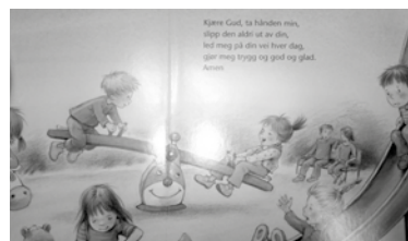
Boka «kjære Gud ta hånden min har gode illustrasjoner og korte bønner som beskriver barns hverdag.