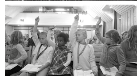
Oppdrag salmebok: Agentene lærer både nyere og tradisjonsrike salmer på agentdag i kirken

full arbeidsdag kan hente barna etter jobb.