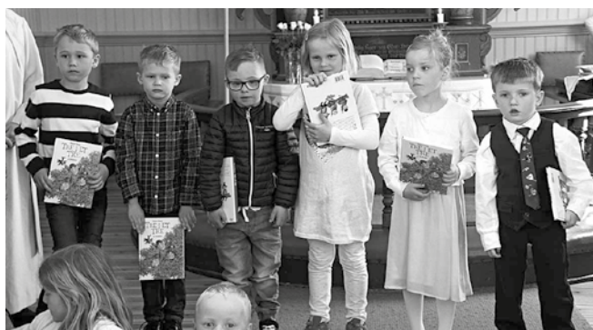
Noen av seksåringene som var i Ullerøy kirke for å få seksårsboka 22. april