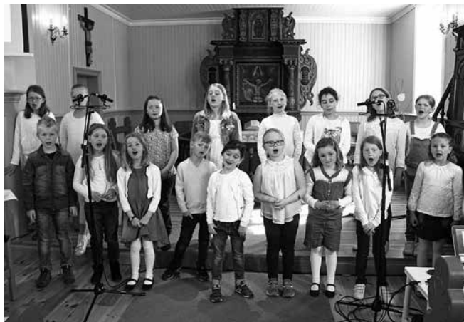
En gruppe fra Ingedal, Ullerøy og Skjeberg kirkes barnekor sang på gudstjenesten i Ullerøy kirke

andre er det en utfordring at SFO åpner sent. Lekser må gjøres helst i samarbeid med foreldre og mange starter på organisert fritidsaktiviteter som barna må hentes og bringes til. Først og fremst har kanskje skolestarten blitt tegnet på at barnet plutselig og virkelig har blitt STOR! Mange voksne er litt bekymret for om barna klarer alt som forventet av dem på skolen. Bokstaver og tall er bare en liten del. Nå må barna kle på seg passe med utetøy, finne plassen sin, gå på do alene, ta vare på bøker og til og med i-pad, huske å spise før det ringer ut, få nye venner, kanskje ta skolebuss, kanskje gå hjem alene etter SFO.... Det er med bekymring, stolthet og forventning familien sender barnet inn i den nye verden; skolen! Det er dette skolestartmarkering i kirken handler om. Hver ny førsteklasing er helt unik og spesiell. Rett og slett førsteklases. De fortjener å kjenne at de har en egen plass i kirken og at kirken har plass til hele dem. På skolestart-