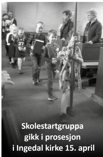
Skolestartgruppa gikk i prosesjon i Ingedal kirke 15. april