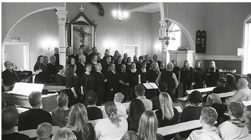
Mandag 7. mai hadde Six Wings Gospel konsert i Skjebbergdalen kirke. Kirken var fullsatt, og de fremmøtte kunne kose seg med flott musikk i nesten halvannen time.