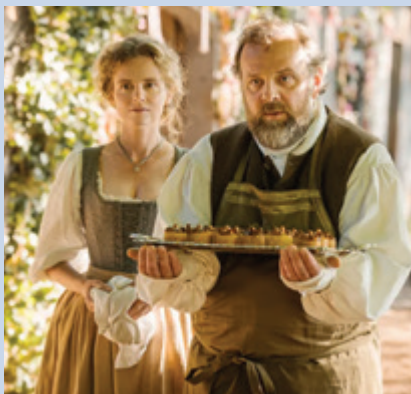
Pensjonistfilm: Dèlicieux Tirsdag 7. mai kl. 15.00