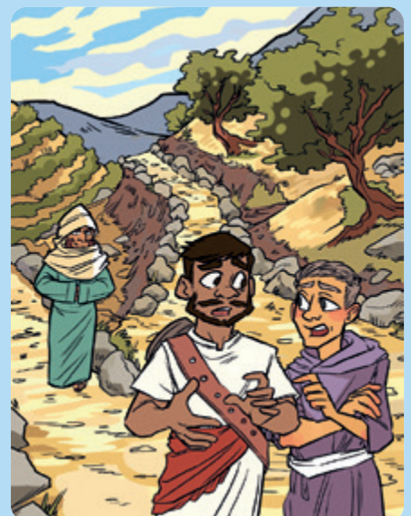
Tegning: Faye Simms

Bruk Det nye testamente i Bibelen for å komme frem til løsningsordet.