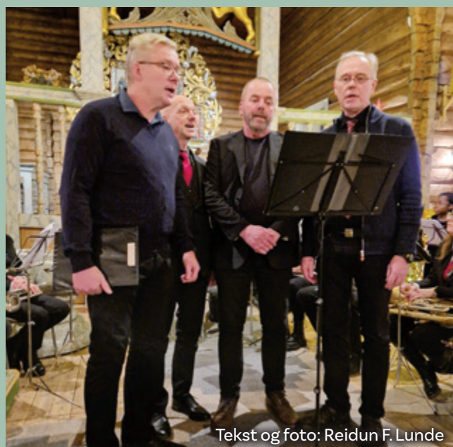
Tekst og foto: Reidun F. Lunde