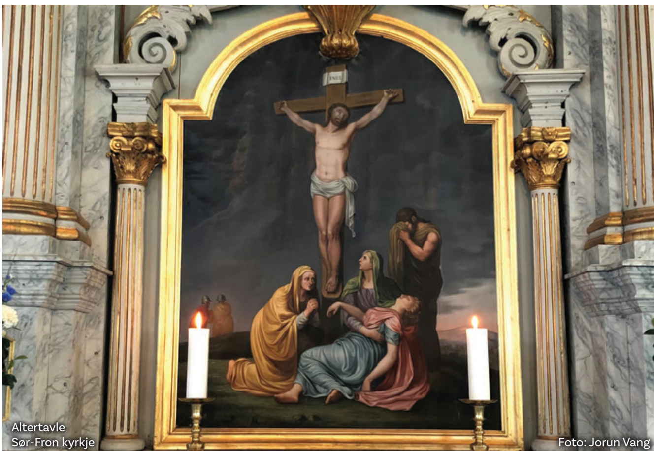
Altertavle Sør-Fron kyrkje