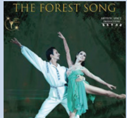
Grand Kyiv Ballett: Skogens sang Onsdag 24. april kl. 19.00