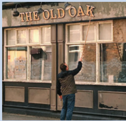
Pensjonistfilm: The Old Oak Torsdag 18. april kl. 15.00