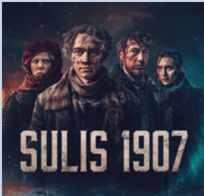
Pensjonistfilm: Sulis 1907 Torsdag 14. mars kl. 15.00