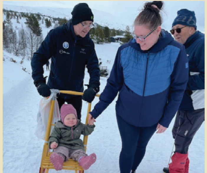
Eldste og yngste deltaker i Rossbu kapell i mars.