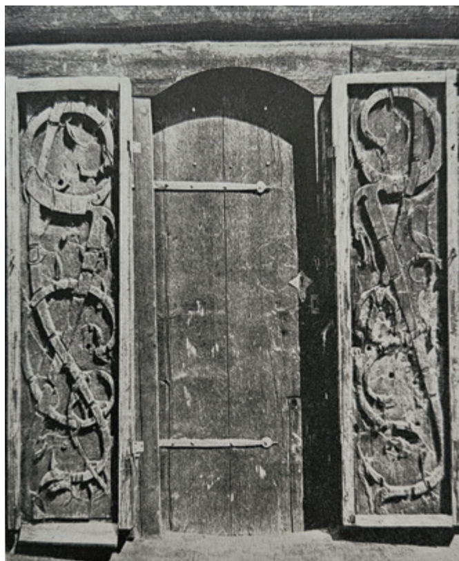
Portalplankar frå den gamle stavkyrkja på Bjølstad plassert på den yngre tømmerkyrkja, antakelig fyst etter 1700-talet. Plankane frå midten av 1000-talet.