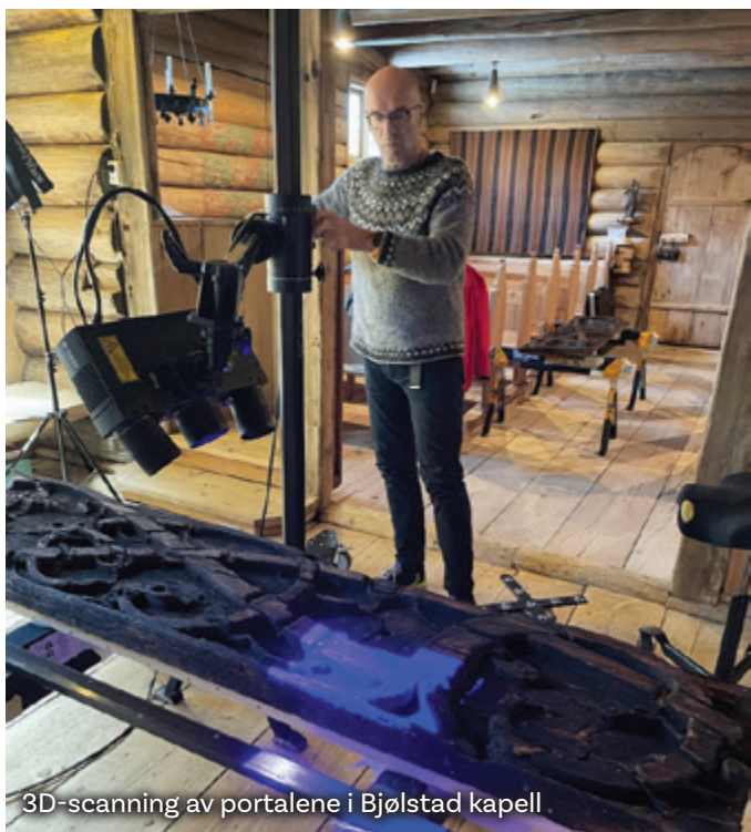
3D-scanning av portalene i Bjølstad kapell

De eldste daterte utskjæringene i Norge er på Urnes stavkirke, og er fra 1070. Plankene på Bjølstadkapellet har samme stil, og kommer trolig fra en eldre stav- eller stolpekirke i Heidal.