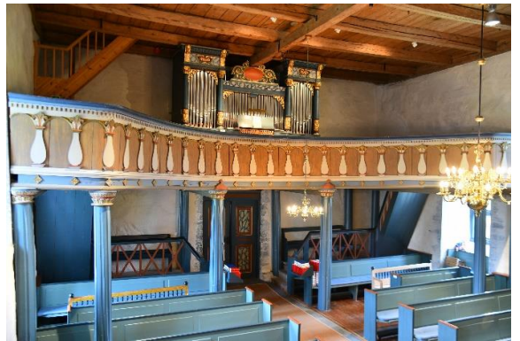
Galleriet med orgelet fra 1925

Som et resultat av pietistiske ideer, vart kirkerommet kalka og kvitmala rundt år 1700. Også prekestolen fra 1665 var kvit. Den vart restaurert i samband med renoveringa av kirka på 1950-tallet, og fikk dermed tilbake sine opprinnelige farger, med unntak av den sida som vender mot veggen. Treskurden og maleria på prekestolen viser de fire evangelistene. Johannes,