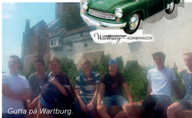
Gutta på Wartburg.

Ungdommene synes at dette er en flott opplevelse – det er jo noe litt annet enn en vanlig ferie. Vi har en foreløpig tanke om at de tyske ungdommene kan komme hit i tiden like før olsok neste år. Følg med på nettsidene våre og facebook-sidene til menighetene i Skaun!