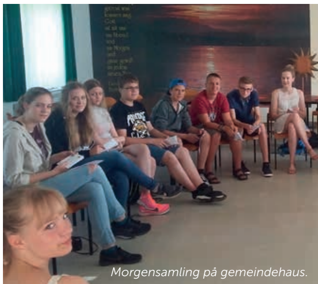
Morgensamling på gemeindehaus.