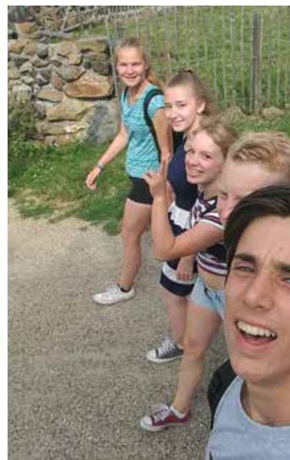
Ungdommer på tur til Silbersee.