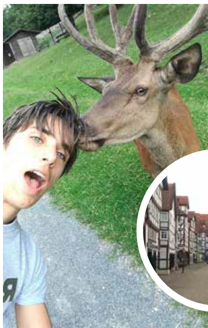
Tierpark Knüllwald. Innfelt: Bindingsverkshus i Tyskland.

Reisen hjem ble litt mer spennende enn vi kanskje ønsket. Det skyldtes at ikke alle koffertene rakk gjennom tollen på Gardermoen før det egentlige flyet vårt gikk fra Oslo. Det førte til at vi måtte ta et litt senere fly, men dette «skjønte ikke» alle koffertene, og for enkelte av dem tok det noen dager før de kom fram til sine eiere.