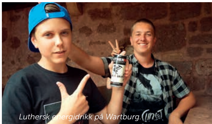
Luthersk energidrikk på Wartburg.

Ungdommene synes at dette er en flott opplevelse – det er jo noe litt annet enn en vanlig ferie. Vi har en foreløpig tanke om at de tyske ungdommene kan komme hit i tiden like før olsok neste år. Følg med på nettsidene våre og facebook-sidene til menighetene i Skaun!