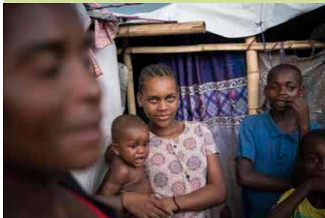
Kany med familie.

Det blir mulig å støtte opp om aksjonen ved å gi i bøsser, men også ved å sende et valgfritt beløp via Vipps til 2426, eller ved å sende SMS med kodeordet GAVE til 2426 (200 kr).