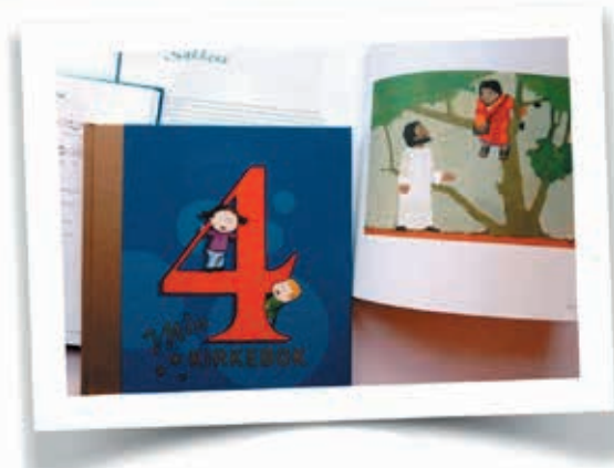
Utdeling av 4-årsbok på gudstjeneste i Buvik kirke 11. september kl. 11.