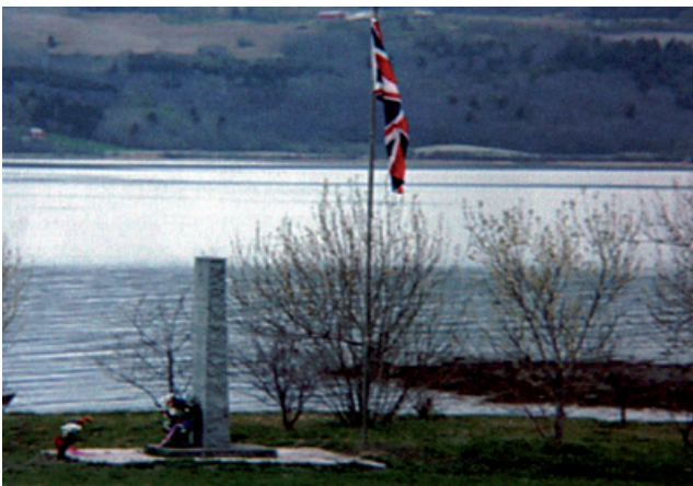
Foto: Bautaen over dei to britane.

Da junidagen gjekk inn til ro – låg to frå framandt land og sov i fred der ingen strålar trengjer ned