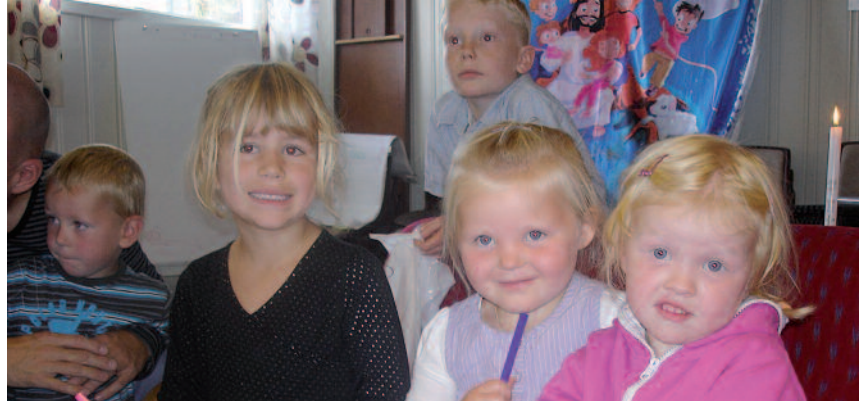
Barn i fra Eggkleiva og Børsa koser seg sammen på søndagsskolen.