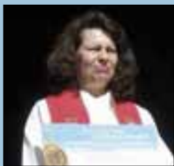
Pilegrimsvegen til Nidaros... side 3