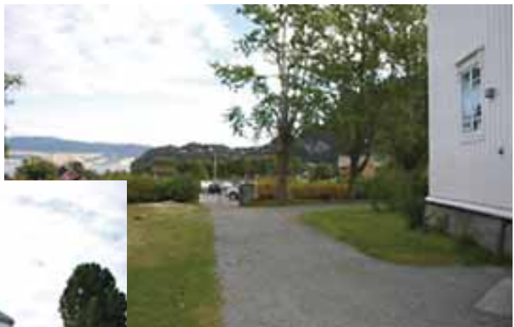
Trærne til høyre for inngangsstien skal også felles.