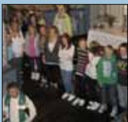
Konfirmantene side 6