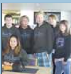
Tysklandsbesøk side 7