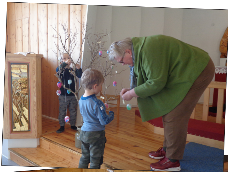
Tekst og bilder: Helena Wright

Det har vært full fart på aktiviteter for barn og unge i år: Først ut, i februar, var det samarbeid med Barnelaget Stjernen på Bagn, der jeg viste filmen om Kirkerottene. Så fulgte Tårnagenter på Bagn. Så tok jeg turen innom både TENKO og SALTO, da vi hadde planlagt en filmkveld sammen for barn og unge fra 11 år, som ett ekstra tiltak fordi så mye var blitt borte pga. korona. Det ble en koselig filmkveld i Begnadalen kirke og ungdommene ga uttrykk for at vi godt kunne lage oppfølger. Så det tror jeg vi skal – kan jo bytte på litt hvilken kirke vi er i. I slutten av mars var det invitert til «Ingen på Jorden er Himlen så nær» - sanggudstjeneste og utdeling av to eller treårsbok for Begnadalen og Hedalen. Det var også konfirmantdag samme søndagen og det var flott å ha med seg konfirmantene på denne gudstjenesten i tillegg til noen småbarn som kom. Dette er en litt annerledes type gudstjeneste der vi bruker mange sanser, mye sang og lek og lite ord. Vi prøver også å konkretisere mange abstrakte ting, slik som bønn, dåp, mm. Hele gudstjenesten er lagt opp som en vandring i kirkerommet, slik at det ingen som vil må sitte stille. (De som ønsker får lov.) I april var det påskevandring med barnehagebarn i Begnadalen kirke og Reinli kapell.