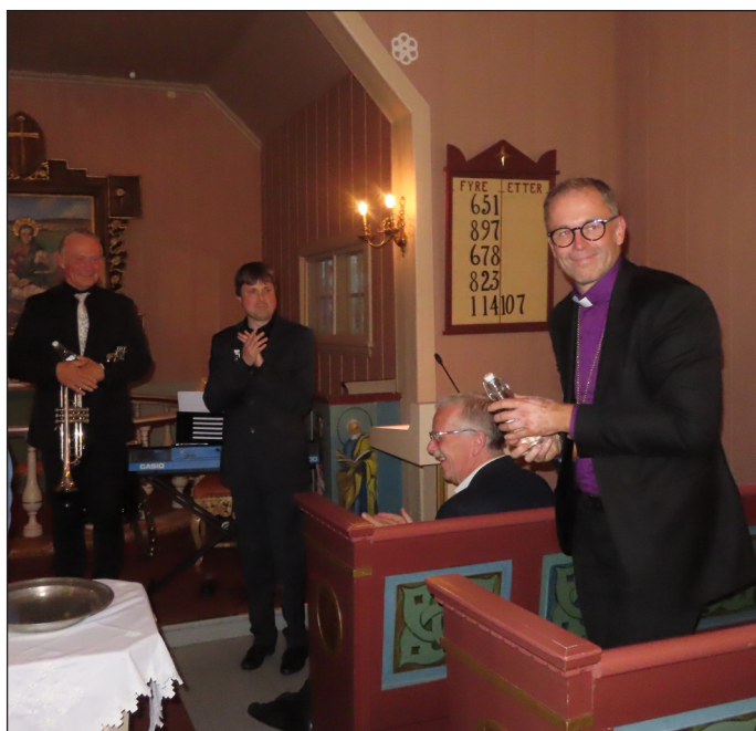
Biskopen fekk og med seg vatn frå Olavskjelda