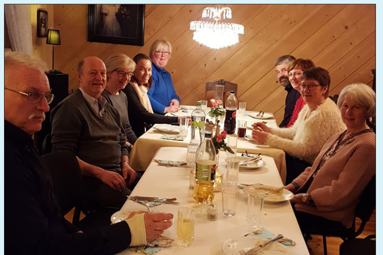
Fest for frivillige i Begnadalen menighet. Takk for den gode innsatsen dere gjør for menigheten. Hilsen Begnadalen menighetsråd.

Hvert år setter vi ut slike skilt på gravsteder der vi ikke har registrert fester, men som tydelig fortsatt pyntes.