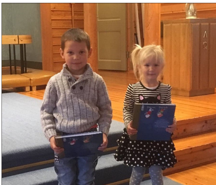
4 åringene i Begnadalen med sin 4 års bok.

Flueplagen er stor i Leirskogen kirke. Flueene kommer sannsynligvis inn gjennom luftkanaler. Det ligger døde fluer over alt. Flueene dør i hopetall, og selv om Kirketjener Tore går med støvsugeren fredag før gudstjenesten – må han ut med feiekosten igjen på søndagen før messe.