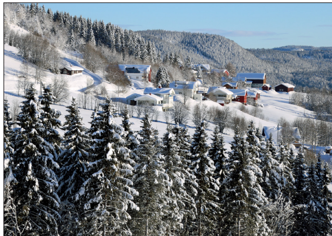
Hagagrendvegen i Reinli.