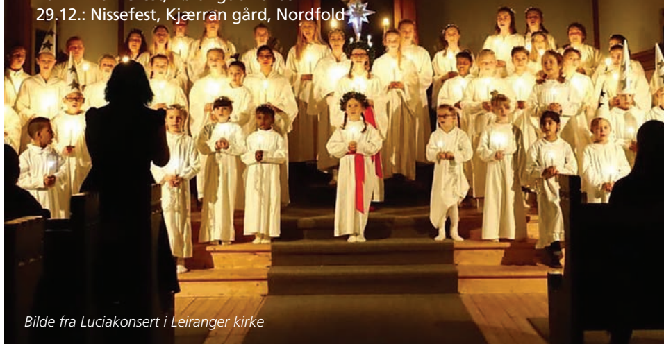
Bilde fra Luciakonsert i Leiranger kirke