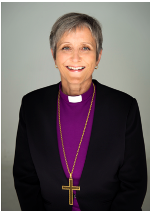
Biskop Herborg Finnset

Tekst: Herborg Finnset Biskop i Nidaros bispedømme