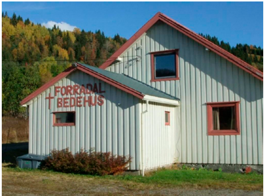
Bedehuset i Forradal

Huset ble mye brukt i denne tiden og det var nødvendig å holde det i god stand. Storsalen ble pusset opp. Nytt gulv i gangen og kjøkkenet, og oppvaskmaskin og ny varmtvannstank. Foldedør mellom storsalen og lillesaalen. Huset ble malt utvendig og parkeringsplassen oppgruset. I begynnelsen var det kronerulling som hjalp på med økonomien. Senere har det vært mange basarer og forskjellige arrangement-