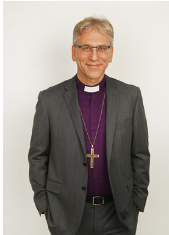
Olav Fykse Tveit

Men påska er også ei forteljing om håp. Det er ikkje ei forteljing som hoppar over det vonde og vanskelege, men ei forteljing om at Gud er til stades i alt det vonde, i alt det verste, også. Sjølv når vi ikkje klarar å tru det. Når påskedagen kjem med sitt budskap om at Jesus overvann dødens krefter og sto opp igjen, vert det ei samla forteljing som verkeleg gir grunn til feiring. Men det er ei feiring som blir ståande som djupt meningsfull i møte med alle slags forteljingar om lidning, angst og død. Til alle tider. Og ikkje mindre denne påska.