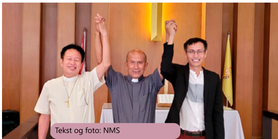
Tekst og foto: NMS

Den evangelisk-lutherske kirke i Thailand (ELCT) har avholdt sin årlige generalforsamling. I år var det