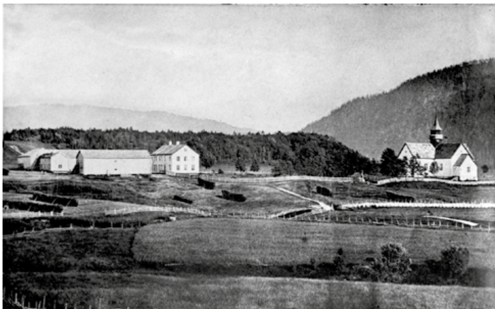
Hegra prestegård og kirke i 1860

Boplikten for prester falt bort i 2015, men fortsatt kan presteboligen stilles til disposisjon dersom det er behov for det.